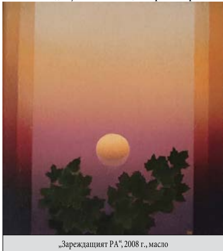
„Зареждащият РА“, 2008 г., масло

и седнал настрана, нещо скицираше. Виждаше ни се странно това занимание, но едрата фигура и съсредоточеното лице на Христо ни респекти-