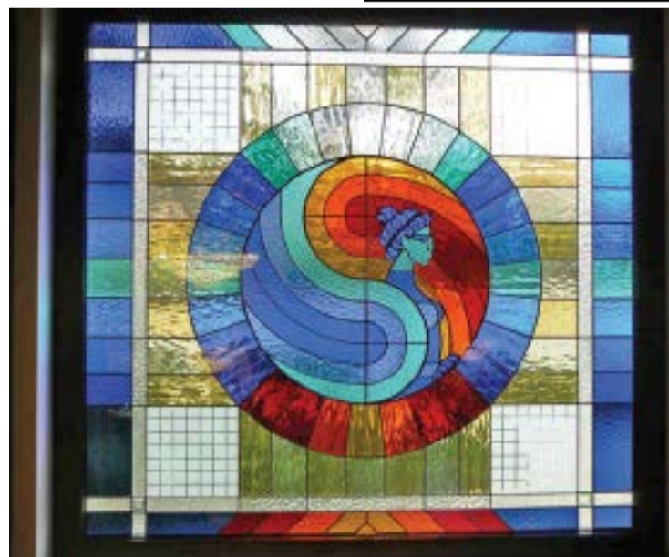
Парк-Хотел „Стара Загора“, стъклопис