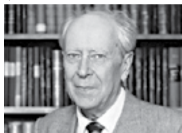
АКАДЕМИК ДМИТРИЙ ЛИХАЧОВ

Убеден съм че ако не аз бях награден, то някой друг щеше да бъде, защото нашите научни търсения в тази област са много близки. И не само в сектора по староруска литература в Ленинград (той, разбира се, е най-големият), но и в московския сектор, който подготвя изданието на Паисий Хилендарски.