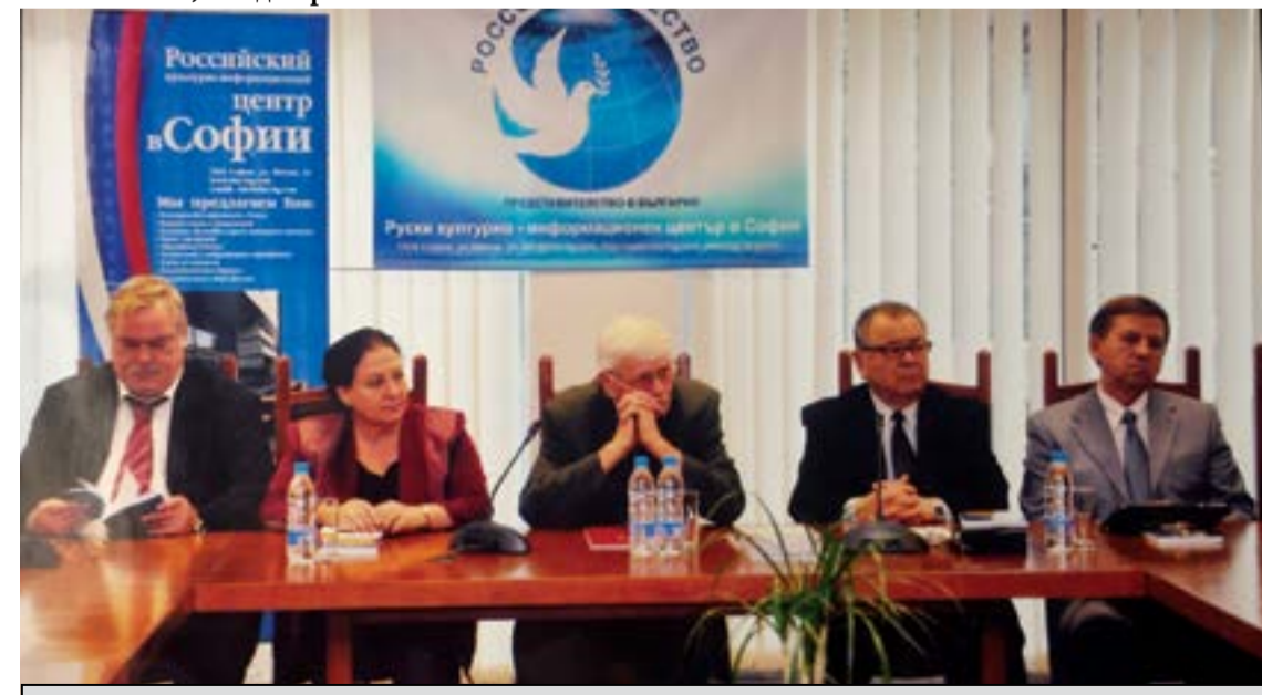
Представяне на книгата „Европа и Славянският свят“, в превод на руски език. РКЦИЦ-София, 2013 г.

силите от страна на определени властимащи, той не превръща страданията в религия на унижението, а остава верен на своя идеал за по-добър свят и превръща убежденията в съвест на разума. Защото вярва в непобедимостта на правдата. И тогава той се придържа към собствената си максима: по-добре тръгнати в очите на нечестивците, отколкото живот в сянката им. И побеждава. Той непоколебимо следва знаците на съдбата, за които получава прозрение още в юношеските си години. Успява да се издигне над дребните неща и смело се хвърля в околната буря и водовъртежа на живота, знаейки, че го очакват тежки изпитания. Със своята доблест и несломимо достойнство респектира онези, които не го харесват, но изпълва с възхищение приятелите си.