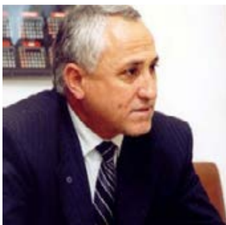
Проф. Мюмюн ТАХИРОВ

За акад. проф. д-р Орлин Загорев творчеството е постоянно състояние на дух, начин на съществуване и самоутвърждаване. На перото му принадлежат над 80 книги и над 250 статии, студии и монографии. Общият брой на рецензиите за творбите са около 200. Неговите книги са преведени на много езици и се намират в редица чуждестранни библиотеки. Той е член на Борда за международни изследвания на Американския биографичен институт (IBI), номиниран от Международния биографичен център (IBC) – Кембридж. Член на Съюза