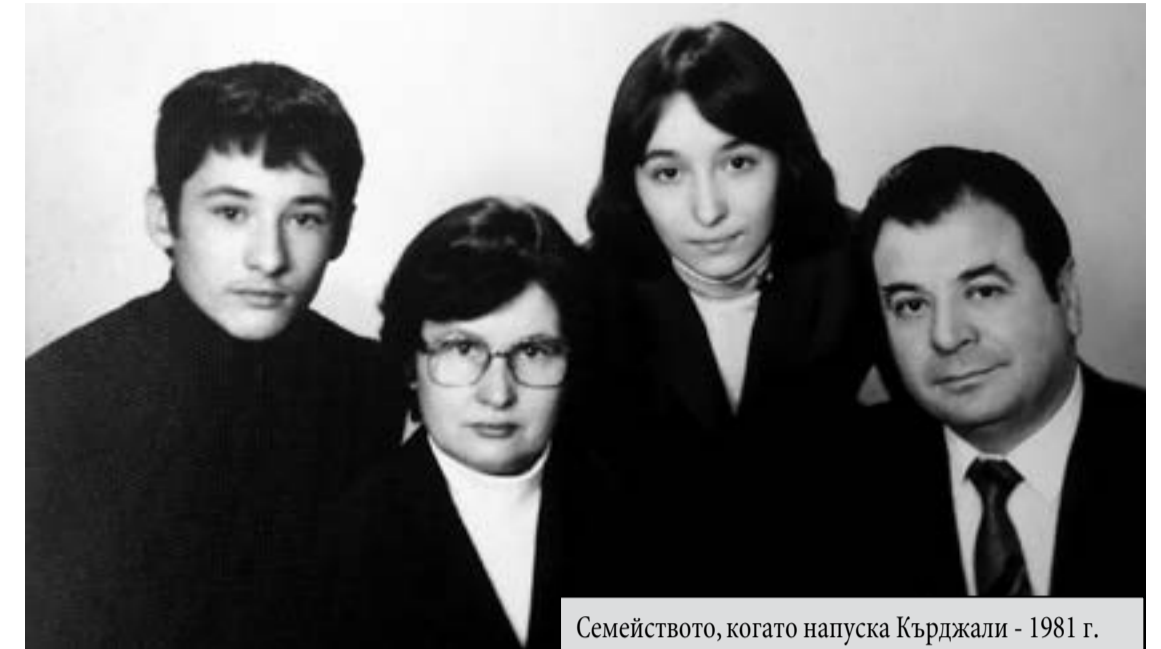
Семейството, когато напуска Кърджали - 1981 г.