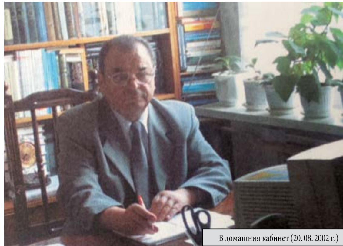
В домашния кабинет (20.08.2002 г.)

последствията и белезите от предстоящите изпитания.