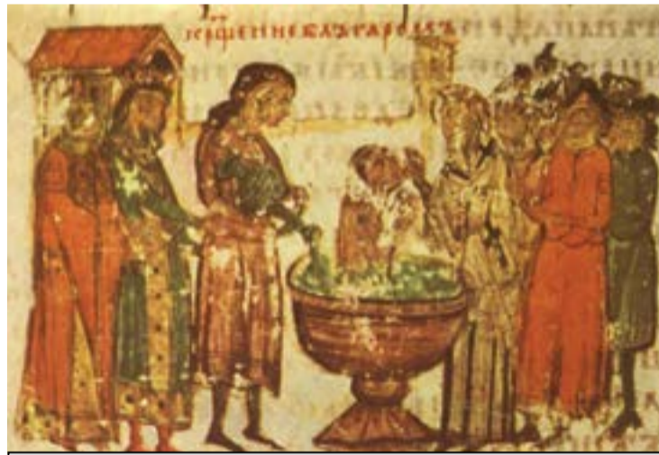
Миниатюра 57 от Манасиевата летопис, 14 век: „Покръстването на българите“

Щастлив съм че получих наградата и я възприемам като награда за съветската наука, не лично за мен. Старата литература ни обе-