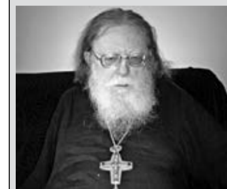
Архимандрит РАФАИЛ (КАРЕЛИН)

Към края на второто хилядолетие постепенно започна реабилитацията на жителите на Содом и Гомор. Оказва се, че делата на sodomитите не са имали характер на престъпление, следователно тяхното наказание е било незаслужено, а Мъртво море се явява паметник на един несправедлив съд. За тази реабилитация е нужно постепенно и последователно да се подготви общественото мнение, с което се занимават телевизията и пре-