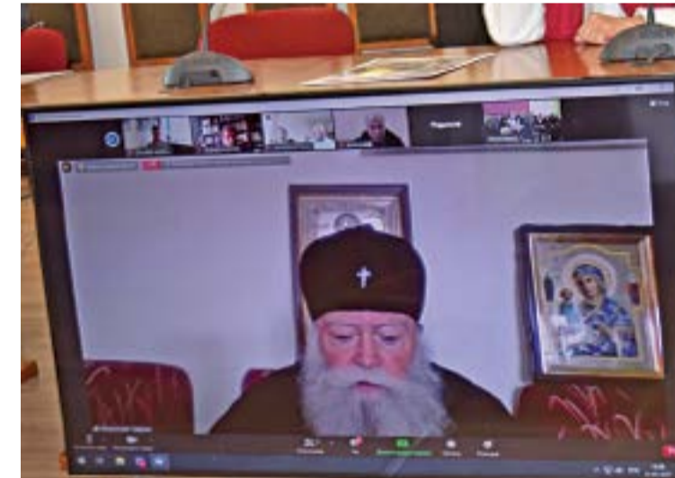
Негово високопреосвященство Гавраил - митрополит на Ловчанската епархия.

„За първи път в историята на Северния полюс се случва подобно събитие - да достигне до него копие на свята реликва, каквато е Самарското знаме, изработено в