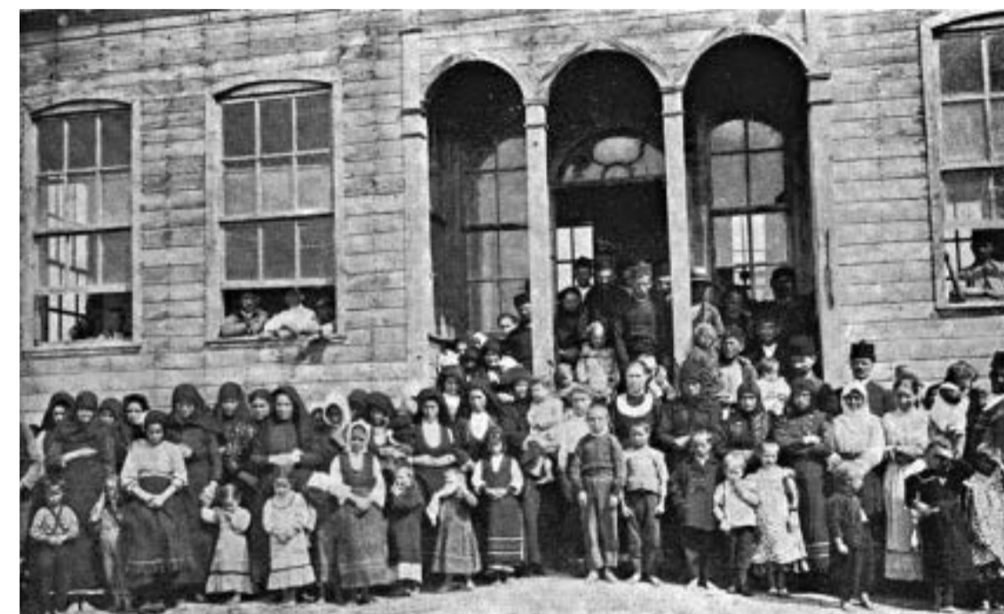
Бежанци от Тракия в Царево.

чрез турските медии и турския политически и обществен живот не е път към приобщаване на Турция към Европа, която започва от България, нито път към бъдещето, към което са устремени и съвременните турски политици. Ако трябва