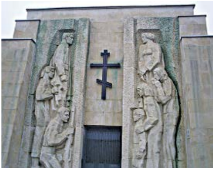
Паметник-костница на Ботевите четници в Скравена.

Ботев видя народа, земята си, видя майка си и либето си, но вече беше много късно да се спре при тях – той ни ги посочи, отмина ги и „умря“, защото времето му се беше из-