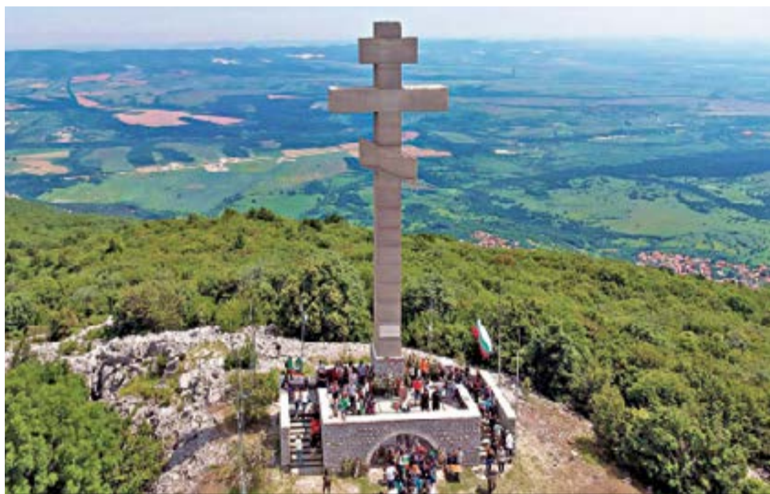
Паметникът на Христо Ботев на връх „Околчица“.