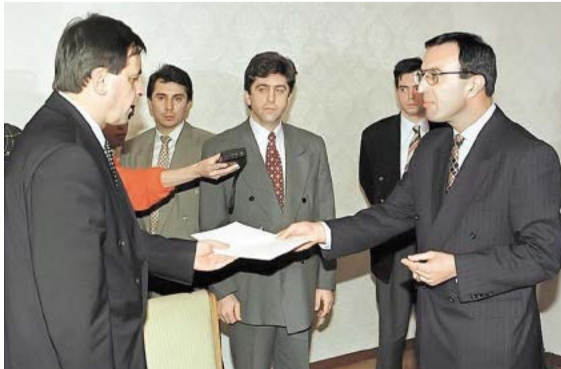
04.02.1997 г. Николай Добрев, в присъствието на Георги Първанов, връща мандата на президента Петър Стоянов.