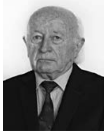
Проф. д-р Стоян ТАНЕВ