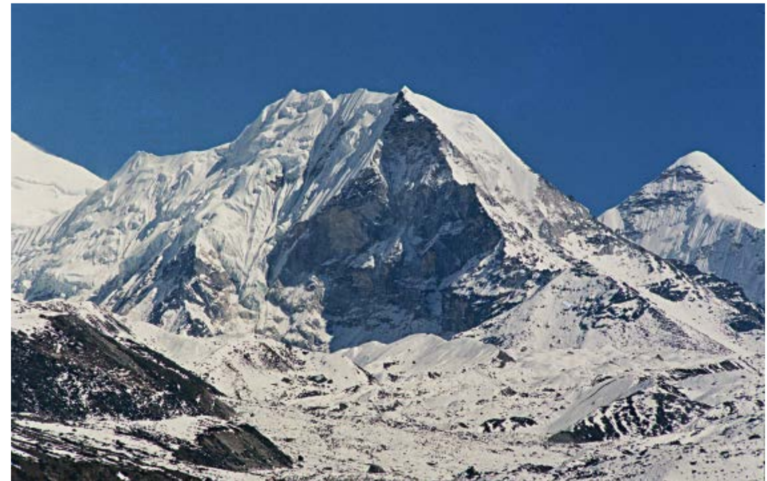
Айлан пик (Имджа Тце 6100 м). Първи български трекинг връх в Хималаите.

змс Христо Проданов изминава последните метри по гребената на Лхоце. Но това разбираме едва на следващия ден, когато в Периче, на 4000 м, започваме да срещаме първите българи, слизащи с керван от базовия лагер на Националната експедиция „Лхоце-8511“. Колко радостни съзвиза се проляха тогава! Не се бяхме виждали с приятели цели 2 месеца, през които те строяха лагер след лагер към върха, а ние вървахме по нашата Голгота през 9 планини с пикели, вместо да откъснем поглед от покрива