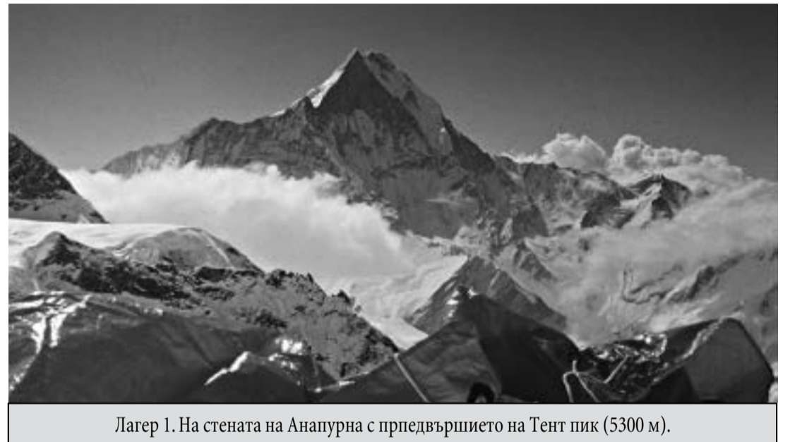
Лаяр 1. На стената на Анапурна с предвършието на Тент пик (5300 м).

Тилман прави с приятели ис- торическо пътешествие (тре- кинг) от източен Непал към Соло Кхумбу, изкачва се на Кала Патар (5545 м), вижда от- там Южното седло между Лхо-