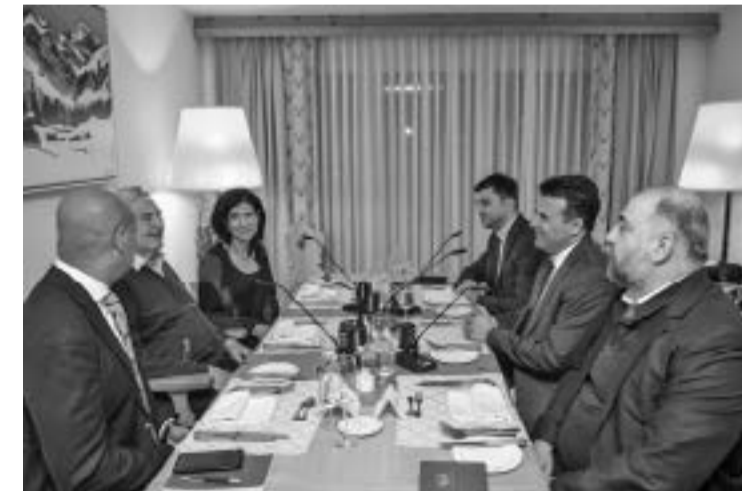
Премиера и милиардера по време на работната част от тяхната втора среща в Давос, 24 януари 2019 г.

Двайсетина дни по-късно, на 18 февруари 2018 г., по време на т.нар. Мюнхенска конференция по сигурността, соросовите възпитанци - министърът на външните работи на Македония Никола Димитров и министърката