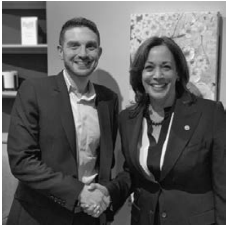
Александър Сорос-младши подкрепя Камала Харис за нейното избиране за вицепрезидент на САЩ, 11 август 2020 г.

(10.02.2021 г.) съобщил за агресивно откровение на северномакедонския премиер, който в своето тясно обкръжение е заявил, че „Спасот на македонизмът е што сега Америка “е криши бугарски кости“. Сиреч: „Спасението на македонизма е, че сега Америка ще троши български кости“. По всяка вероятност самият Заев много лесно може да се отметне от своите думи. Правил го е неведнъж и нищо няма да му попречи да го направи и сега. Но ако не нещо друго от тези негови думи може да се разбере скавки чувствата е зареден спрямо страната ни „приятелот на Бугарија“. Освен това, че и той не изостава от идеолога на модерния „македонизъм“ - лидера на ВМРО - ДПМНЕ Християн Мицкоски, който възнамерява да превърне тази сърбоманска доктрина във верую на всички етноси в Северна Македония. Оказва се, че самият Зоран Заев се е нагърбил с още по-непопулярна задача ...спасяването