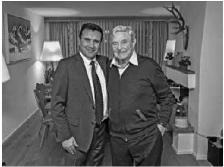
Зоран Заев и Джордж Сорос по време на тяхната втора среща в Давос, на която се обсъжда приемането на Северна Македония в НАТО и ЕС, 24 януари 2019 г.

Само броени месеци по-късно, на 10 ноември 2019 г., по покана на Зоран Заев и президента Стево Пендаровски,