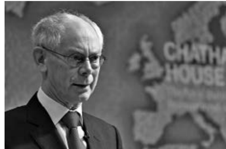
Бившият председател на Европейския съвет Херман ван Ромпой обозначи истинската политика на ЕС: „Трябва да се откажете от всякакви опити за възстановяване на националната идентичност, няма народ, няма родина! Европа е нашият универсален дом!“

закони. Трябва да се отбележи, че за постигането на тази благодарна цел трябва да се работи върху съзнанието на гражданите на всяка отделна държава от Съюза, Например, следвайки официалната политика на Европейския съюз, който предишен председател Ван Ромпой е заявявал, че трябва да се откажем от всякакви опити за възстановяване на националната идентичност, че няма народ, няма родина, Европа е нашият универсален дом. Или следвайки апела на сегашния Върхов-