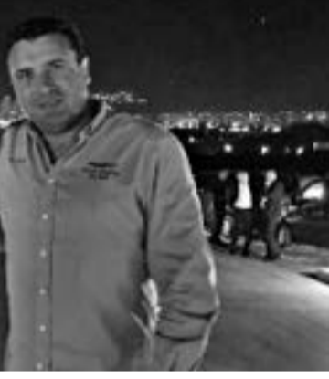
Зоран Заев и Александър Сорос-младши след тайната среща в Охрид, 10 ноември 2019 г.

(10.02.2021 г.) съобщил за агресивно откровение на северномакедонския премиер, който в своето тясно обкръжение е заявил, че „Спасот на македонизмът е што сега Америка “е криши бугарски кости“. Сиреч: „Спасението на македонизма е, че сега Америка ще троши български кости“. По всяка вероятност самият Заев много лесно може да се отметне от своите думи. Правил го е неведнъж и нищо няма да му попречи да го направи и сега. Но ако не нещо друго от тези негови думи може да се разбере скавки чувствата е зареден спрямо страната ни „приятелот на Бугарија“. Освен това, че и той не изостава от идеолога на модерния „македонизъм“ - лидера на ВМРО - ДПМНЕ Християн Мицкоски, който възнамерява да превърне тази сърбоманска доктрина във верую на всички етноси в Северна Македония. Оказва се, че самият Зоран Заев се е нагърбил с още по-непопулярна задача ...спасяването