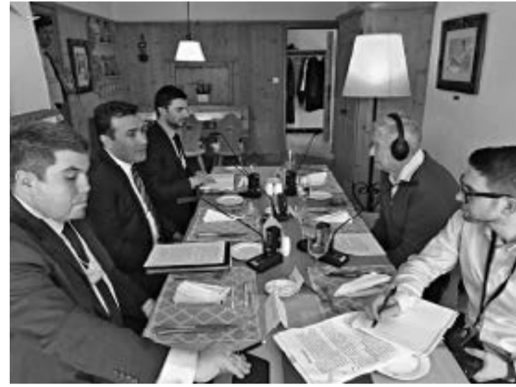
Първа среща на Зоран Заев (вляво в средата) с Джордж Сорос и неговия син Александър Сорос (вдясно), от която става ясно, че новото лице на република Македония ще се гради върху концепцията на... „Отворено общество“, Давос, 26 януари 2018 г.

Колко струва един премиер? Не е никаква тайна, че на 1 юни 2017 г. „социалдемократии“.