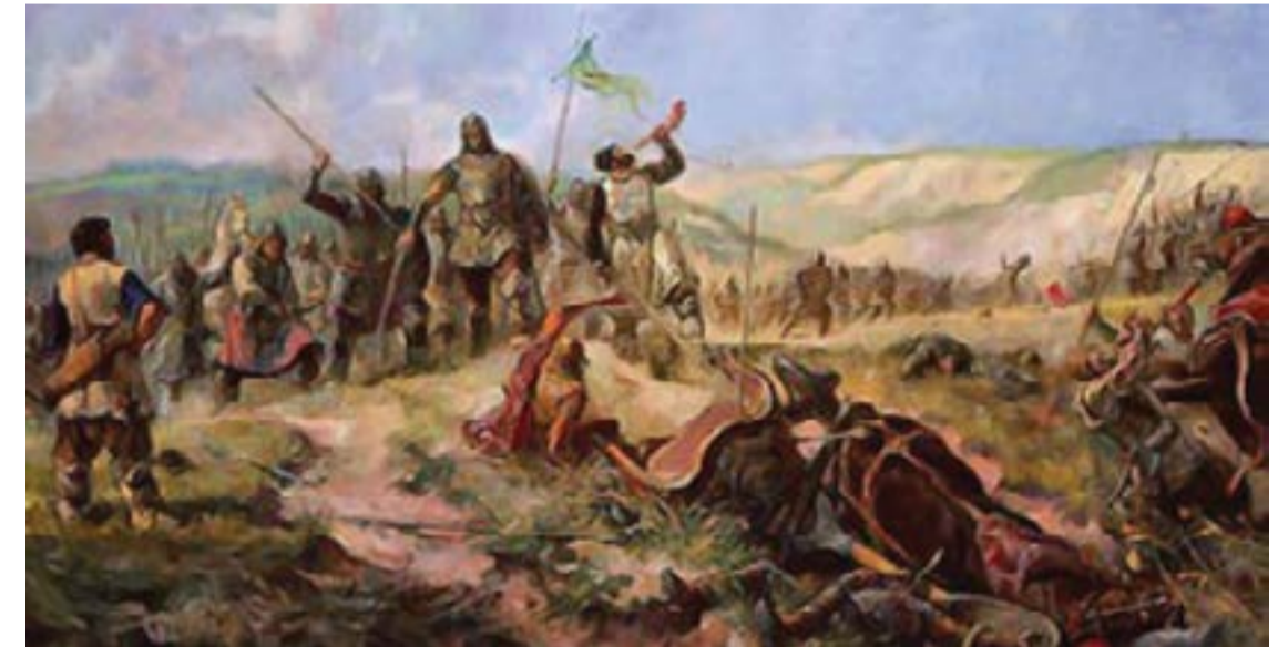
„Ивайло разбива Константин Тих“, художник Илия Петров.

теоретик във вълновете на реформатор на неовизантийската невматика, живял и творил векове преди класическите западноевропейски композитори. За неговата музика Егон Велес, австрийски изследовател казва: „Тя е етап на съвременно общество, което няма паралел в западната нотна система.“ Османското нашествие през 14 в. прекъсва естествения духов-