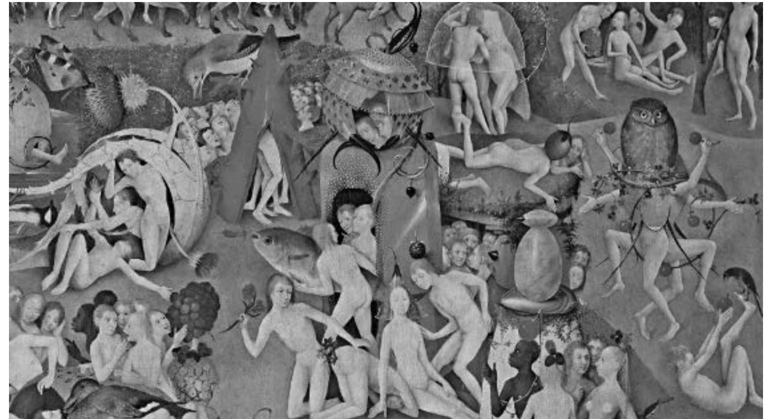
Детайл от триптиха „Градините на земните удоволствия“ на Йеронимус Бош.

зиран инициативи за изкореняване практиките на сплъщане. На 15 юни 2011 г., Съветът на ООН по Правата на човека приема резолюция 17/19, утвърждаваща равенство между хората, независимо от тяхната сексуална ориентация или джендърна идентичност.