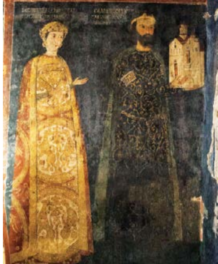
Севастократор Калоян и съпругата му Десислава. Сенопис от Боянската църква.

Фактът и чудото на гените. През 2000 г. завърши най-големият досега генетичен проект в Европа, изследващ ми-