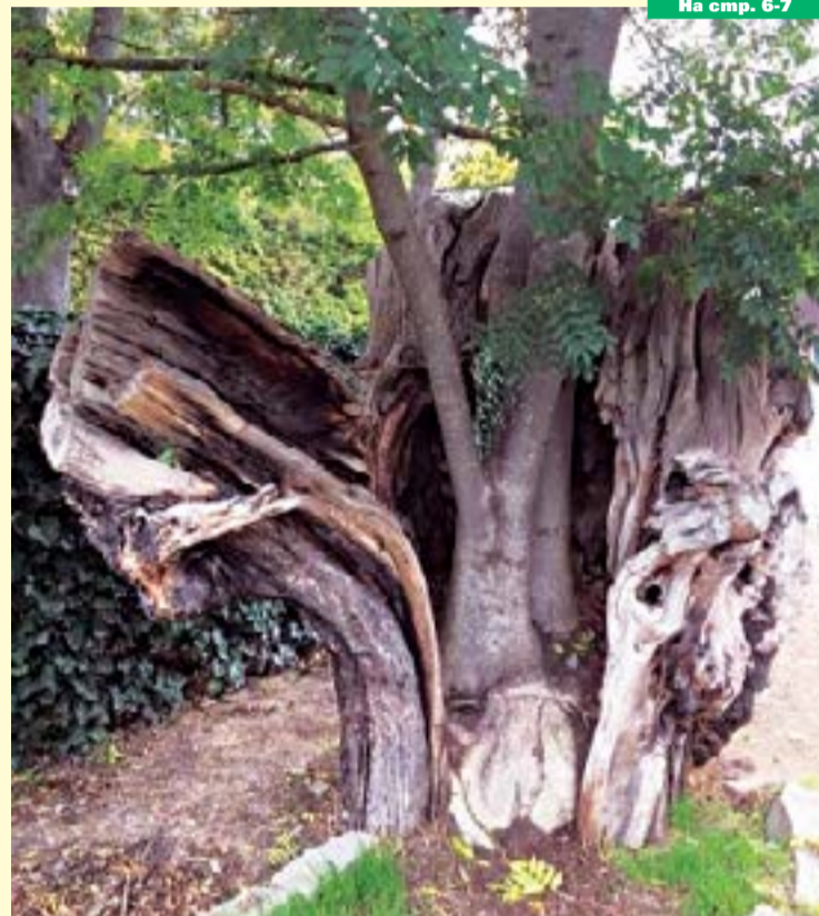
Алегория на българския дух и Възраждане.