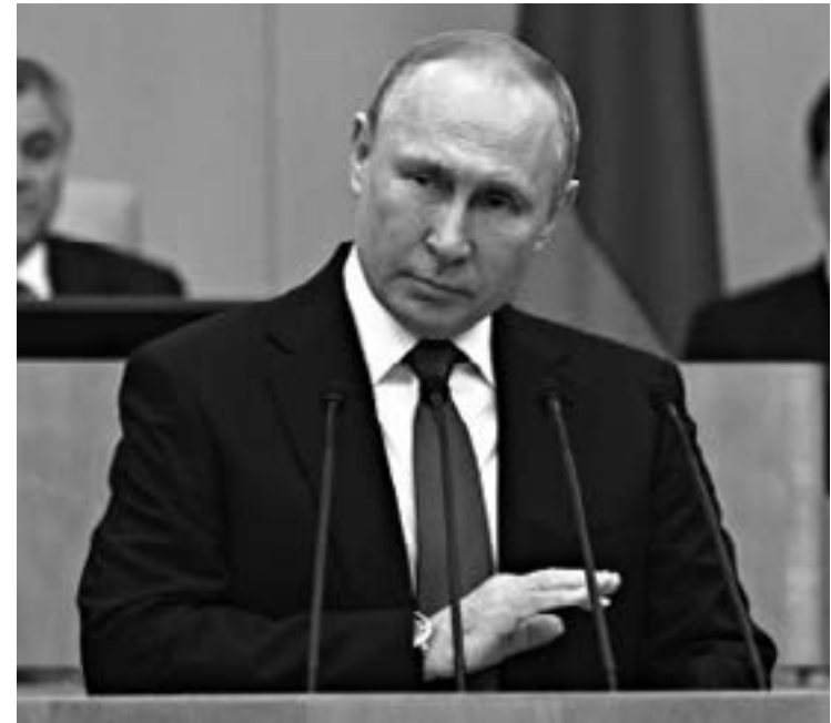
Путин решително отхвърли отредената роля на Русия да бъде покорен ученик на западната цивилизация.

Не случайно Путин бе превърнат в главно плашило и ***СССР действително при формирането на социалистическия лагер от държави с единна идеология и политическа насоченост. Той създаде тази общност от държави под флага на СИВ и Варшавския договор, за да се защити от агресията на чуждата му западна идеология, начин на живот и финансово-икономическа система. Нещо, което сега се опитва да прави Европейският съюз. Но ако в социалистическия лагер не беше ярка изразена истерията на агресивността, то ЕС съществуваше най-вече заради нея самата и само психологическото напрежение, създавано от образа на врага, обединяваше страните вътре в съюза. Няма ли враг, няма да има и НАТО, тъй като цялото значение на защитата и обединяване.