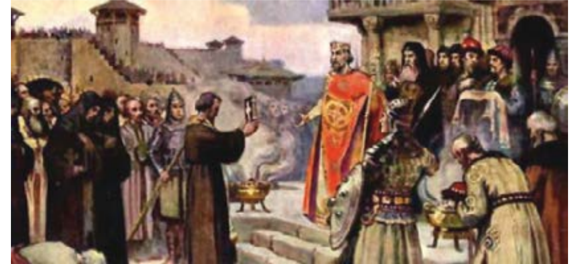
По време на управлението на св. княз Борис-Михаил Покръстител, на 4 март 870 г., е обособена и прогласена като автономна Българската православна църква.

ин (1670-1671 г.), нито Емилян Пугачов (1773-1775 г.) – никой! Десетилетия след смъртта си, името му вдъхновява съпротивителни движения в Европа и Азия. За него писателят Стефан Цанев пише: „Просто Ивайло е сбъркал къде да се роди. Ако беше се родил във Франция щеше да е станал национален герой и светия още преди седем века. Имате още преди седем века. Имате още преди седем века. Имате още преди седем века. Имате още преди седем века.“ Поетите от цял свят цяха да се надпреварват да пишат за него, както за Жана д'Арк. Но не би!“ В някои от учебниците по „История и цивилизации“ за 6-ти клас, като тези на изд. „Прозвета – плюс“, 2017 г. и „Бувест 2000“, 2016 г., липсва цял период от българската история - този от средата до края на 13 век, отнасящ се до татарското нашествие, междусобните борби, въстанието и възкачането на Ивайло на българския престол. А това е единственото селско въстание не само в българската, но и в европейската история, увенчало се с успех, при което личност без благороден произход, законно заемат властелския престол. Това е, все едно, децата във Франция да не учат и да не са чували за Жана Д'Арк, нещо напълно немислимо и абсурдно, но не и по отношение на представяне на българската история и герои.