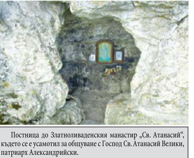
Постница до Златноливаденския манастир „Св. Атанасий“, където се е усамотил за общуване с Господ Св. Атанасий Велики, патриарх Александрийски.

Българи, траки, скити, кимерийци, готи и славяни са един и същ народ, населявал голяма част от Европа и Азия, назоваван с различни имена през различни епохи, които преди са носители на най-древната култура в света – Културата Варна и които преди Потопа са населявали бреговете на Черно море, основно западното и северното му крайбрежие. Ние, българите, сме по-стара цивилизация от шумерската, египетската, еврейската и гръцката. Когато обаче искат да омаловажат този факт, те наричат истината с изрази като „компенсационен синдром“. С това се цели да се внуши, че понеже сме никои и