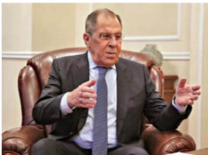
Сергей Лавров, министър на външните работи на Русия.

Лавров визираше срещата на високо равнище на държавните глави в ЕС през следващия месец, където отново ще се обсъжда Русия и, подчерта, че тя няма никакви илюзии относно поведението на „ненадеждните партньори“, които би следвало да се държат като възрастни.