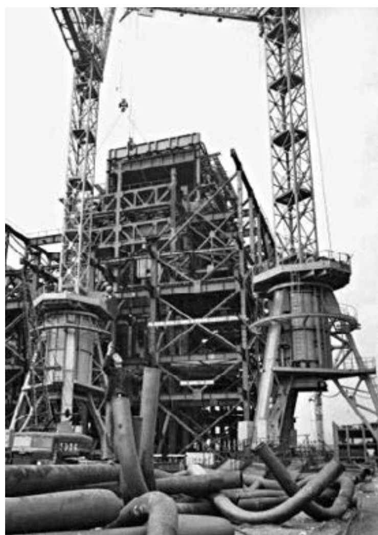
През 1976 година се извършва монтажа на отделните елементи на първи котел на ТЕЦ "Марица-Изток"-3.

Учените вече са категорични. Процесът на изнасяне на топлината от слънчевото греене и разпределението на температурата в тропосферата (до 11 км)