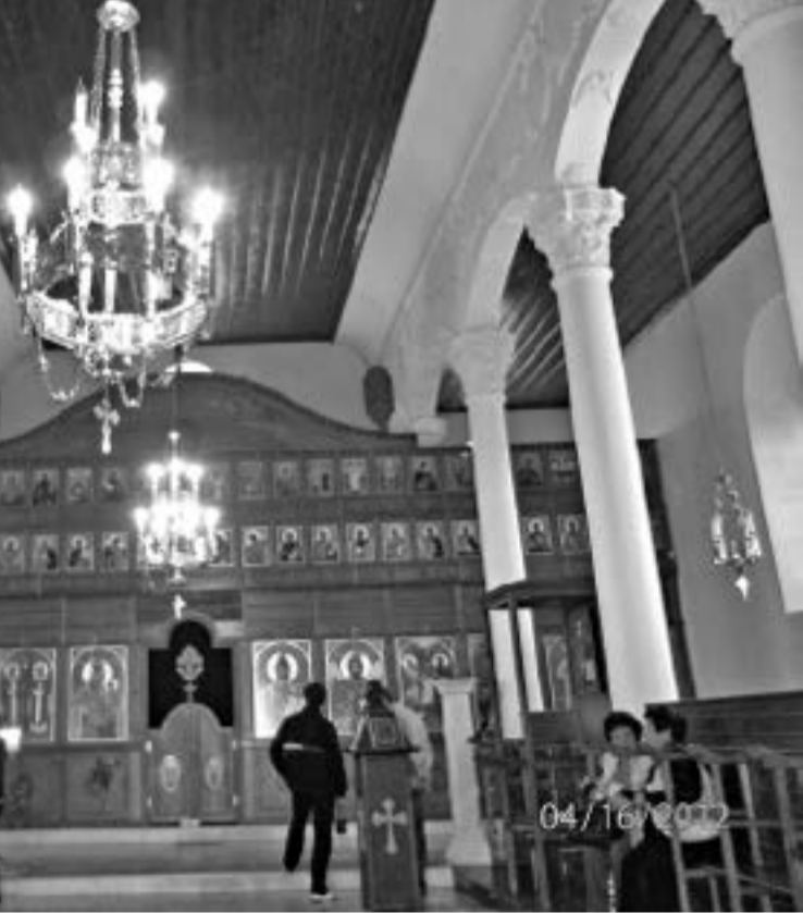
Църквата „Св.Св. Константин и Елена“ в Одрин.

Атинагор (1948-1972), който си позволява да прави изявления от името на целия православен свят. През годините са-