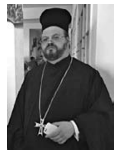
Архимандрит Харалампий (Ничев)

Харалампий напуска лоното на БПЦ, преминава на служба