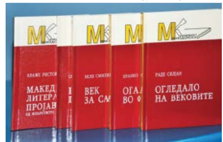
Мегаизданието „Македонска книжовност“ от 135 тома, с което скопските македонисти са си поставили за цел да легитимират своето „литературно наследство“, включително чрез кражби и присвоявания на български книжовници, писатели и поети.

„македонски“, след като, според самия автор, са написани на български?... В том III „Македонски народни умотворби“ - Ст. Веркович бил публикувал „първия по-голям сборник с македонски народни умотворения“. Заглавието на сборника обаче е „Народни песни на македонските българи“ (1860), а не на... македонците. Нашиите лъжи и спекулации са друг начин, чрез който съ-