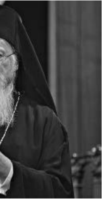
Цариградският патриарх Вартоломей

От многобройни публикации, както в българската, така и в турската преса става ясно, че на 12 февруари 1994 г. Вартоломей заявява на свещеник Константин Костов, че българската православна църква в Истанбул е напълно подвластна на гръцката патриаршия и във връзка с това му разпорежда занаяпред да издава кръщелни и венчални свидетелства на гръцки език предоставяйки му и образци. Това не е единственият опит за наме-