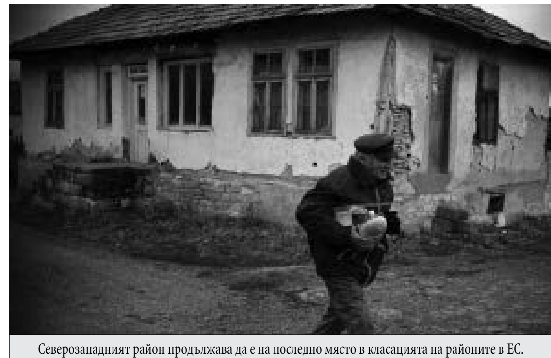
Северозападният район продължава да е на последно място в класацията на районите в ЕС.

В периода 2007-2018 г. износът на страната нараства с 56.6% в реално изражение, като повишава дела си в БВП