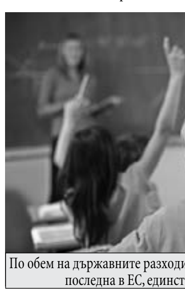
По обем на държавните разходи за образование България е предпоследна в ЕС, единствено Румъния е зад нас.

вет взе решение, следващите избори да се проведат чрез машинно гласуване. Проблемът е, че от тогава до сега минаха 6 месеца, а правителството все още не е привело в действие собственото си решение. Поради тази причина, в сряда, 12-ти август, от 10 часа, ПП МИР организира граждански протест пред Министерския съвет. Нашето искане е да се спазва закона за машинното гласуване и незабавно да бъдат предприети действия за неговата реализация за предстоящите парламентарни избори. Другото наше искане е за незабавната оставка на правителството, което няма нито моралното право, нито доверието на българските граждани, за да продължи да управлява страната.