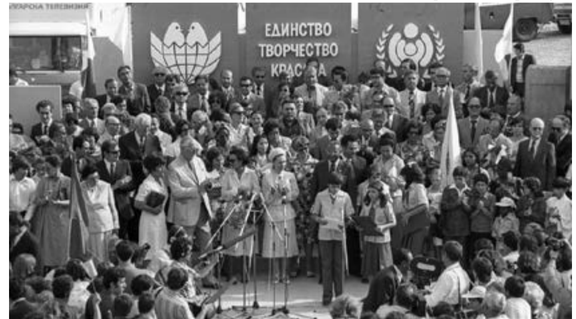
Политиката на Людмила Живкова в областта на културата отвори България към възможността да заеме своето достойно място в лоното на европейската цивилизация.

ност на известния негов Институт по сугестология. Разностранната нейна дейност, която е имала подкрепата на най-обещаващите таланти в областта на науката, историята, изкуството, литературата, е срещала огромна съпротива в старите доктринерски среди на партията, но в същото време е предизвиквала и огромен интерес в чужбина. Младата културна министърка реализира огромни заслуги за подобряване на отношенията с Ватикана, за заличаване на мрачното наследство от 1949 г. и от 1952 г. Благодарение на Людмила Живкова Ватикана отвори своите библиотеки, музеи и галерии за български уче-