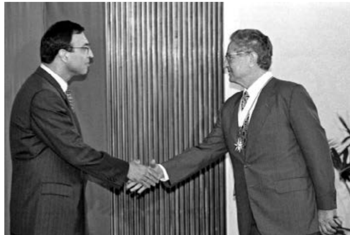
01.06.1997 г. Президентът Петър Стоянов награждава Джордж Сорос с орден „Стара планина“ за особени заслуги.

за крайна цел закриването на националните държави в името на един нов световен ред, начело с една световна сила и едно световно правителство. Това е целта на текущата в момента „глобализация“, на която бе даден такъв оглушителен отпор в американското градче Сиатъл.