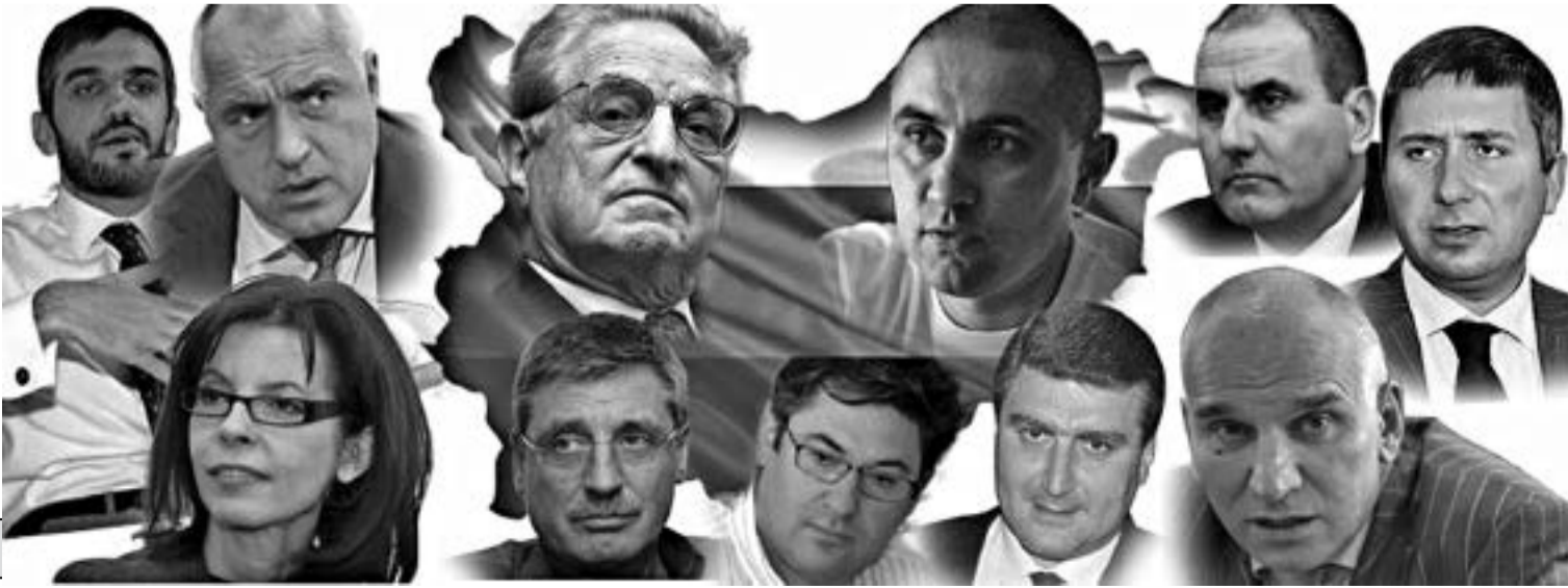
Соросидами и трети лица