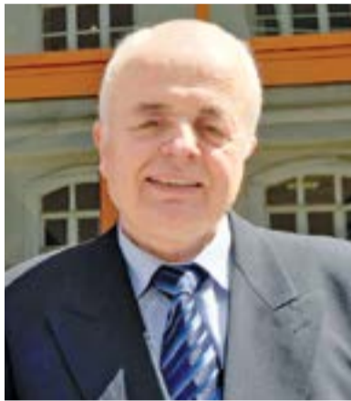
Проф. д.ист.н. Трендафил МИТЕВ