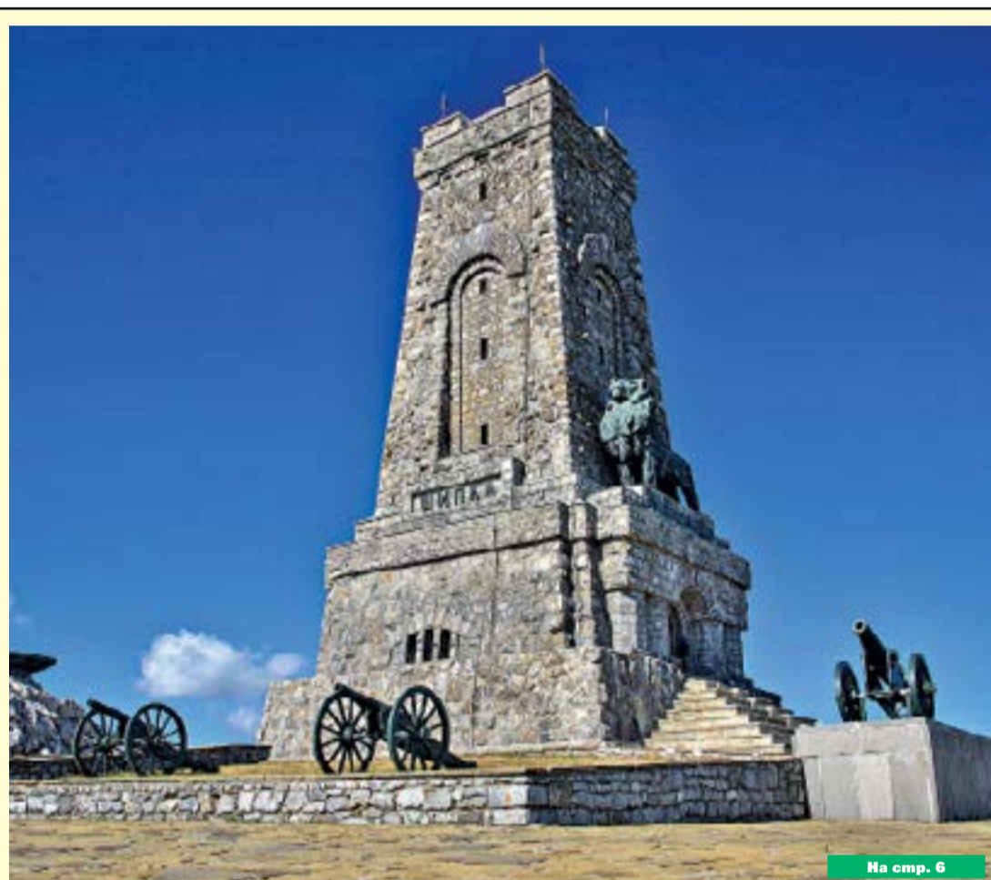
На стр. 6