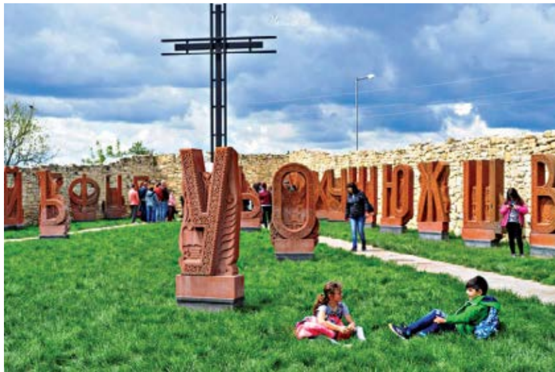
„Горките“ дечица, дали не търсят вече в Двора на кирилицата „горката“ буквичка „Й“?

ние, ала читателят, към който е насочено убогото послание, го възприема радушно, с отворени обятия, харесва го и е напълно съгласен с него. Обаче като променят стила на пропагандата, чуждестранните агенти на влияния, финансирани от чужди неправителствени организации, съхраняват без никаква промяна нейната същност и характер. Пропагандата е елементарна, но очевидно носи някакъв резултат. Особено що се отнася до отродителството и отхвърлянето на миналото под предлог, че „трябва да се гледа напред“. И постепенно фронтът срещу това минало, защото в него са героизмът и преклонението пред българското, уроците на историята