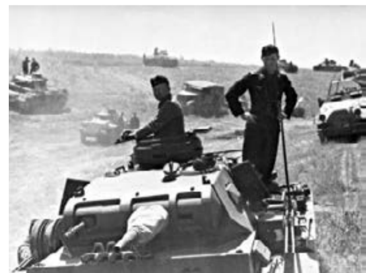
„Веселите танкисти на Гудериан“ едва ли са предполагали каква трагедия ги очаква в просторите на суровата руска земя.

Вермахтът нахлуваше с 3 млн. и 900 хиляди щика, разпределени с германска акуратност в 159 дивизии, с близо 3500 танка и 44 000 оръдия. Неговата техническа съоръженост бе събрала оръжейната мощ на покорените народи в Западна и Централна Европа. Всъщност, срещу СССР бе хвърлена мощта на цяла Европа. От вече завоюваната Франция бяха иззети 5000 локомотива, 250 000 вагона, както и близо 5 млн. тона черни метали, което представляваше 73% от производството на френската металургия. И защото разгромът на Франция бе съкрушителен, то и унижението трябваше да бъде съответно. Нейната капитулация беше подписана в същия железопътен вагон, докаран наред Париж, в който бе подписано и поражението на Германия в Първата световна война. Бе поругана честта и славата на Франция, нейната доблестна и храбра армия. Горко на победените! Иззето бе въоръжението и бойната техника на цели 92 френски дивизии. Малка утеха е, че по същия начин бе постъпено и с 18 холандски, 12 английски дивизии и 6 норвежки. Към "Луфтвафе" се прибавиха още 3000 самолета, а „веселите танкисти“ на Гудериан, получиха 5000 френски танка. Само с трофейния авто-