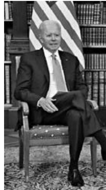
"През 2000 г. Русия беше много близко до загуба на собствения си суверенитет и териториалната цялост, броят на гражданите, живеещи под прага на бедността беше колосален и катастрофален, нивото на БВП бе драстично ниско, златно-валутни-

на близост до руските граници, и за измислените и с нищо не доказани обвинения за вмешателството на РФ във вътрешните работи на САЩ, и т.н. А в края на интервюто Путин, обобщавайки опита и резултатите от почти 20-годишната си служба като ръководител на руската държава, заявява: