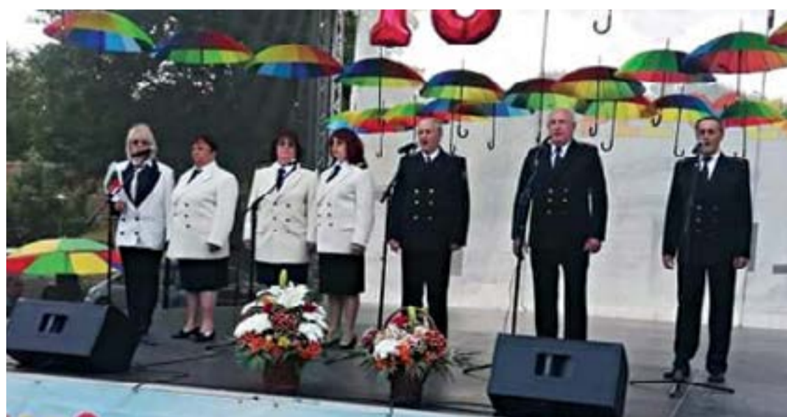
Група за морски патриотични песни „Катерник“, град Созопол.

мъже и много деца, в двора на Регионалния исторически музей.