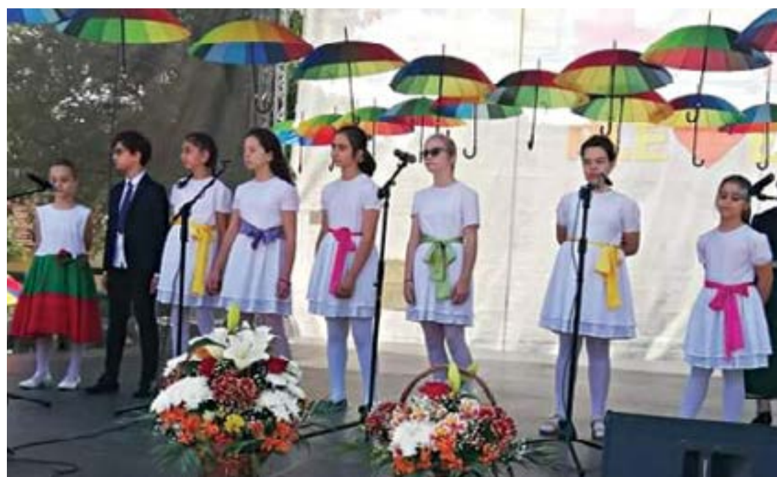
Вокална група „Ботевци пеят“ от начално училище „Христо Ботев“.

нища, която изпълни със страст и артистичен огън „Калина красная“ и българската песен „Богатство“.