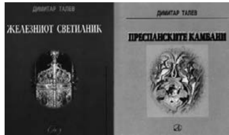
Факсимиле от кориците на романите „Железният светилник“ и „Преспанските камбани“ на Димитър Талев, „македонизирани“ и криминално издадени в Скопие.

Докато Никола Вапцаров е „македонизиран“ изцяло и обявен за „верен син на македонският народ, влюбен в неговото национално минало“ (с. 483). „Своята македонска национална принадлежност и безрезервна любов към Македония поет-