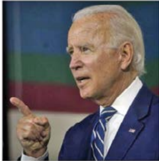
Джо Байдън, президент на САЩ

роятно трудна ситуация за развитие на позитивна динамика между ЕС и Русия. Трябва да имате предвид, че в ЕС нещата съвсем не са хомогенни, необходимо е да ги диференцираме. От една страна имаме скандинавците, поляците и прибалтийците, които се ангажираха активно и подстрекаваха с всякакви финансови, политически и информационни ресурси, протестите в Беларус. От друга страна имаме друга група страни, да ги наречем "централните сили", сред които са Германия, Франция, Италия, Бенелюкс и не на последно място - Австрия. Те се