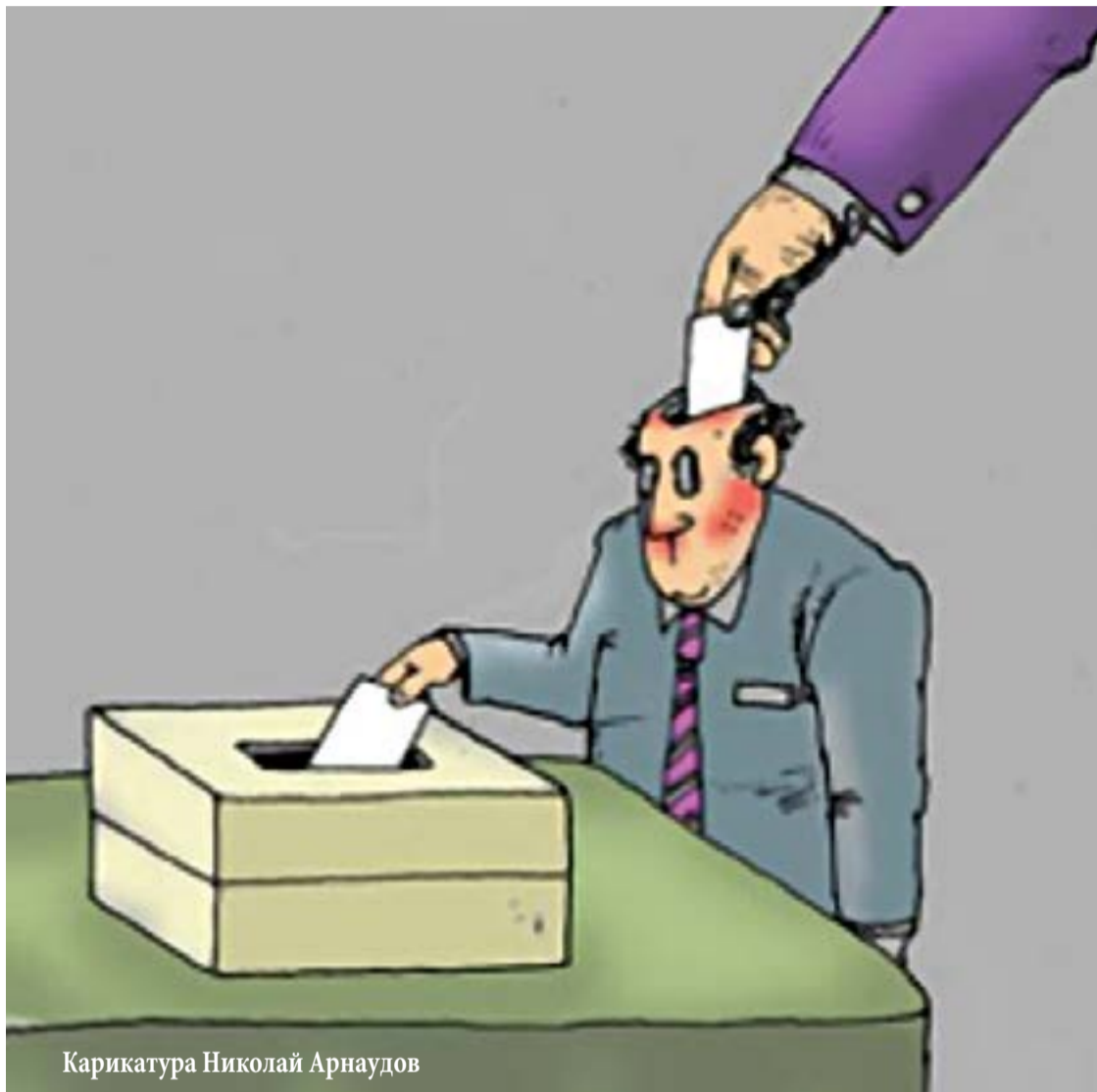
Карикатура Николай Арнаудов