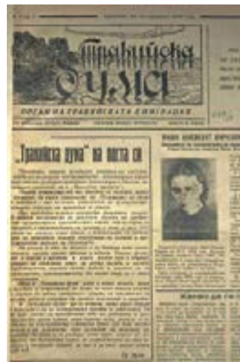
Вестник „Тракийска дума“