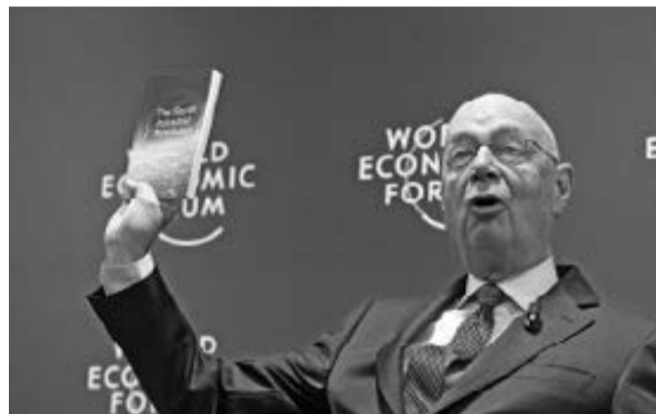
Кlaus Schwab, президент на Световния икономически форум в Давос, Швейцария, на 14. 12. 2020 г. обявя „Разрушване и обновяване на света след КОВИД - 19“.

телство за цялото човечество, само прищопи, ускори структурните промени, представките за които доста отдавна вече бяха се формирали. Пандемията изостри проблемите и дисбаланса, натрупани в света от по-рано. Имаме всички основания да предполагаме, че съществуват рискове за по-нататъшно нарастване на противоречията. И такива тенденции могат да се проявят практически във всички сфери.