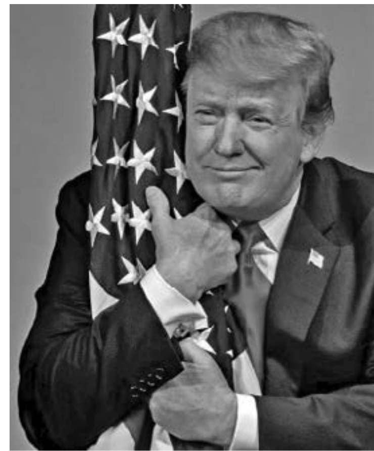
Президентът на САЩ Доналд Тръмп

стремежа за тяхното пренаписване и „ коригиране “ в съгласие с правилните канони. Причината е една единствена и фундаментална: такива отклонения са сериозна пречка за външно манипулиране на електората на тази проблемна нация, осъществявано от добре заплатена, „ нета колонна “, в този случай чисто хуманитарна „ нета колонна “. По-подходящ и успешен пример от България в този аспект едва ли може да се намери.