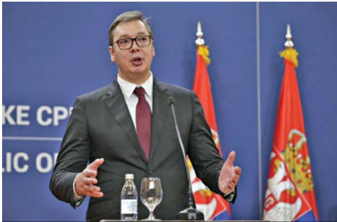
Сръбският президент Александър Вучич подкрепи новите правила за присъединяване към ЕС. Официални кандидатки за членство в ЕС са Албания, Северна Македония, Сърбия, Черна гора и Турция.

литик му хареса да бъде в центъра на общественото внимание, особено след протоколната позиция на лидер на балканска страна - член на ЕС, която за шест месеца бе председател на Съвета на ЕС и всички лидери на Европа му идваха на крак в София, за да се ръкуват с него. Обикновено в такива моменти, той моли майка си да го види от небето! Радост велика, която все още му държи влага и му пречи на обективното възприятие на реалния живот, което за държавен ръководител е самоубийствено. И за да поддържа собственото си усещане за величие, той и външната му министърка, започнаха да се изживяват като "родители" на кандидати за членове на НАТО и ЕС от Западните Балкани. "Ако не слушате, няма да ви пуснем за членове и ще наложим вето!" - с тъпо постоянство, по различни канали се отправят дебелашки намеци. Но изпълнявайки възложената му задача, Борисов направи толкова много гафове, че вече никой не му обръща внимание. Само