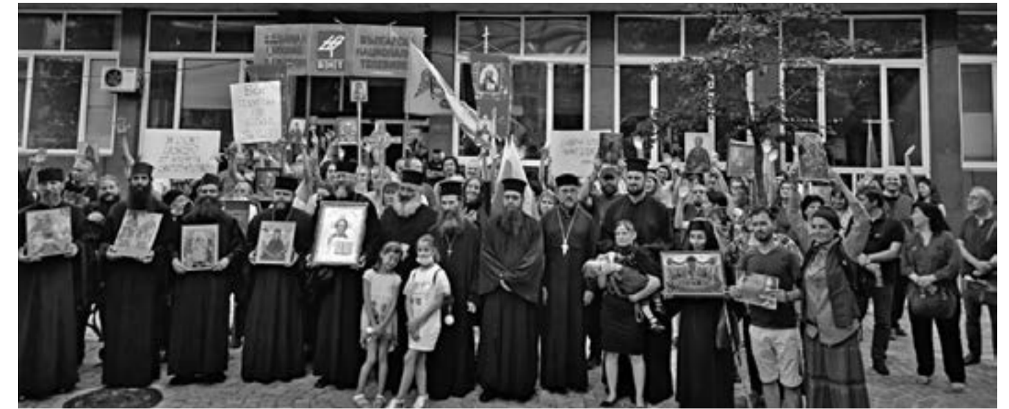
визия имат най-малко право да се меси в тези неща.