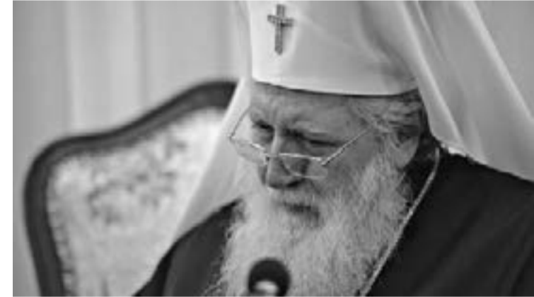
Неофит, Патриарх Български

Светият Синод на БПЦ-БП е изпратил становище, адре- сирано до генералния дире- ктор на БНТ Емил Кошлуков, във връзка с обществените въздействия, свързани с пре- даването „Вяра и общество“ по БНТ1 с водещ Горан Благоев. Публикуваме текста на ста- новището.