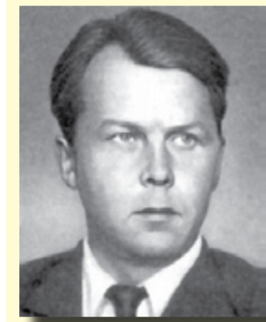
Александър ТВАРДОВСКИ 1910-1971