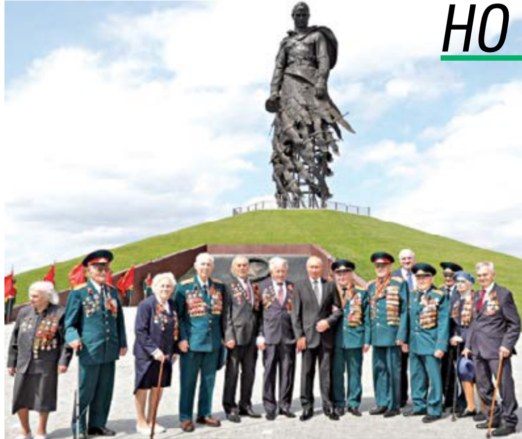
Президентът на Русия Владимир Путин с ветерани пред разтвързания мемориал край Ржев. 30 юни, 2020 г.