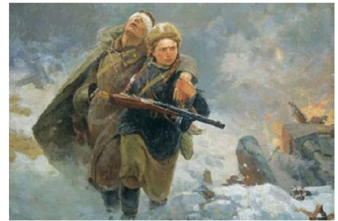
М. И. Самсонов, „Сестрица“, фрагмент, 1953 г.

фронт, надхвърля това число на всички останали съюзнически фронтове поне 10 пъти. Съветският фронт също привлича четири пети от немските танкове и около две трети от немските самолети“. Като цяло СССР представляваше около 75 процента от всички военни усилия на антихитлеристката коалиция. През военните