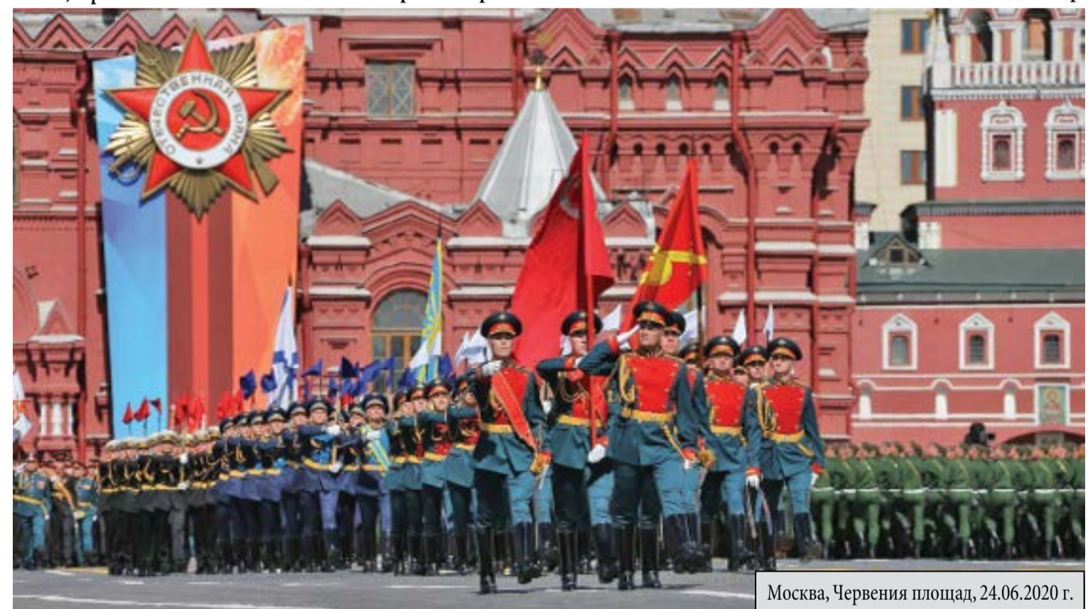
Москва, Червения площад, 24.06.2020 г.

в покрайнините на Варшава. И военно-политическият елит на Полша избяга на територията на Румъния до 17 септември, предавайки своя народ, който продължи да се бори с нашествениците.