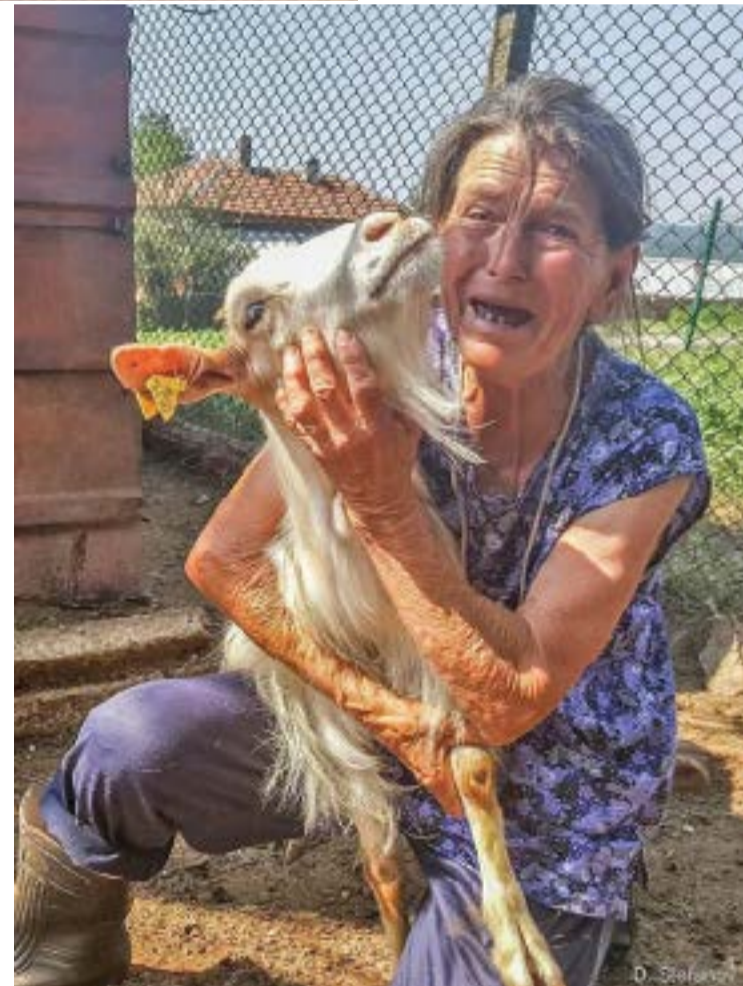
Болката на баба Дора трогна цяла България. Тя ридае безутешно: Не убивайте животните ми, те са мои деца.

Уважаеми български граждани, помнете ли лятото на 2018 г.? На 11 юли Българска агенция за безопасност на храните обяви първично възникнали огнища на болестта чума по дребните преживни животни в селата Крайново, Странджа, Шарково, община Болярово. Последваха редица решения и действия на институциите за умъртвяване на животните. Стопаните от региона не вярваха, че има зараза. И се възпротивиха. В Шарково се стекоха хора от цялата страна и образуваха жива верига около дома на баба Дора. Обърнаха се тогава към нас за помощ и ние заставахме до тях. Водихме битка на два фронта – там, на място с колегите депутати и тук, в Народното събрание. В опита си да спрем необоснованото решение за избиване на животните внесохме редица питания, организирахме дебати. Часове наред лично участвах в разговорите в кабинета на председателя на парламента, където убеждавахме с аргументи щаба, министрите, премиера – да спре! Но не би! Вие, уважаеми управляващи, продължихте. Умъртвихте хиляди животни, без причина! Тогава твърдахме това, а днес, за същото, имаме доказателства.