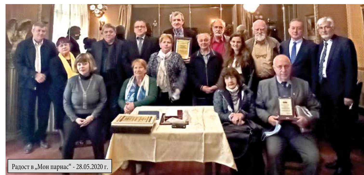
Радост в „Мон парнас“ - 28.05.2020 г.

Тя придвижи към разпад Османската империя и Австро-Унгария; доведе до деградацията на Франция и Германия; загубата на цивилизационното лидерство на Великобритания и присъвяването му от Съединените американски щати. Русия