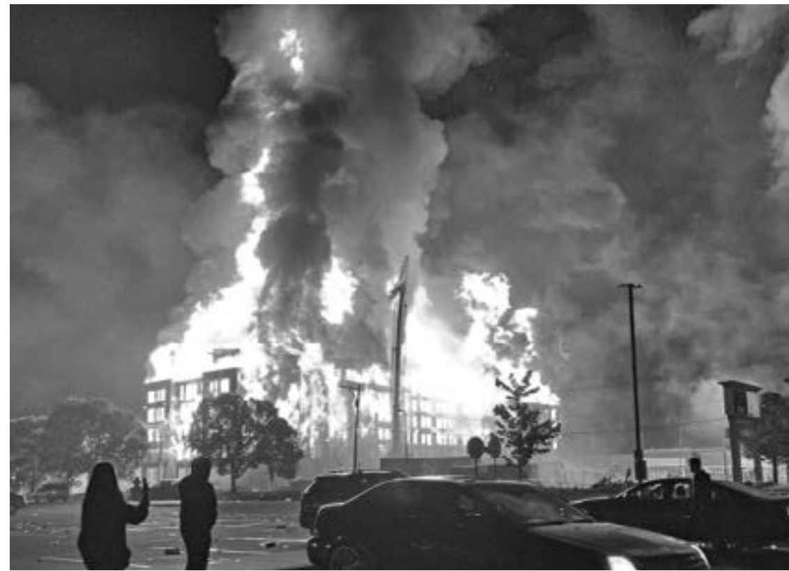
Полицейско управление в Минеаполис гори след протести, прераснали в насилие.

Думата не е преувеличена поне в няколко отношения. През 1951 г. Хана Аренд показва в „Тоталитаризмът“