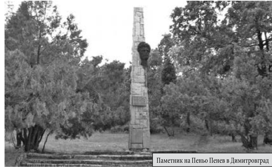
Паметник на Пеньо Пенев в Димитровград