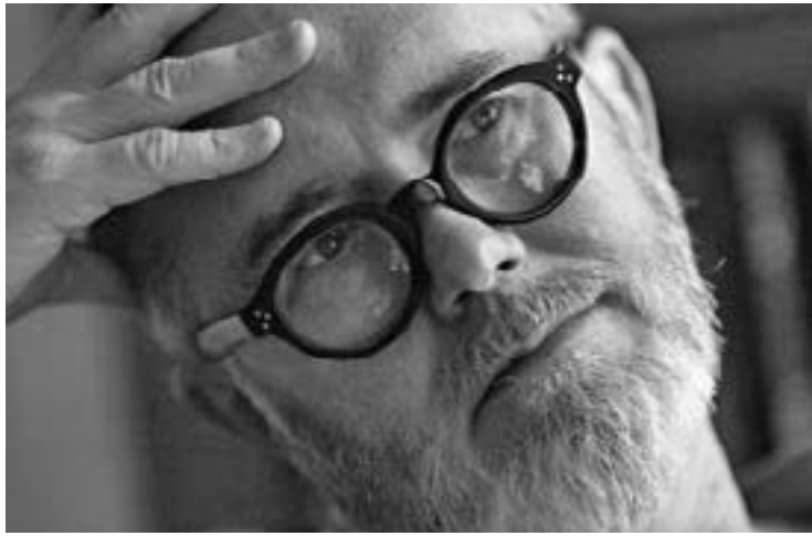
Род ДРЕЕР, "Фигуро"

Внощта срещу събота, губернаторът на Минесота се появи на живо по телевизията и обяви пред журналистите, че положението в Минеаполис е станало толкова сериозно, че вече не е от компетентците на полицията, а на армията.