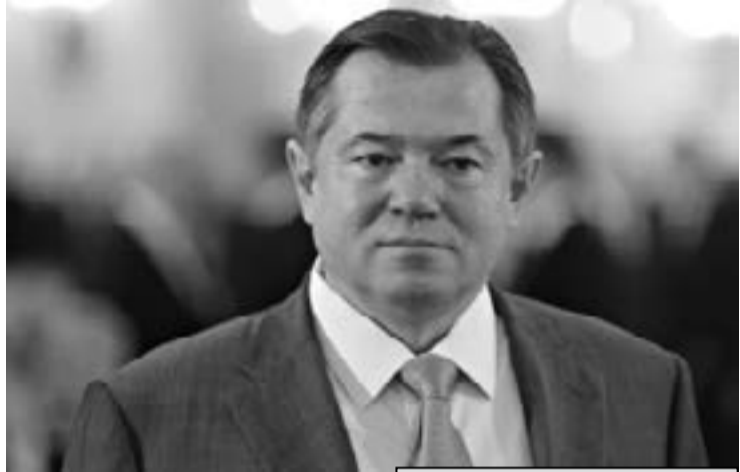
Акад. Сергей Глазев

Да не се осъзнава необходимостта от цялостна поли-