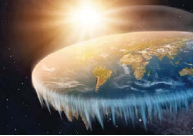
На стр. 8

в лицето на милиардери като Бил Гейтс, Джордж Сорос и др., предлагат, и то доста неприкрито, да се регулира нарастването на земното население без проливане на кръв, а именно с чипизиране на хората и поголовното им задължително ваксиниране срещу наредени за вируси - убийци.