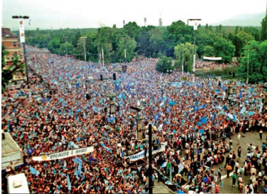
7 юни 1990 г., бул. „Цариградско шосе“

да е същият. От тези фалшиви новини „простолуцието“ така се обърка, че не знае на кой господ да се кланя, защото помни народът наш и този исторически урок „Покорна главица, сабя не сече“. Обаче, сече не сече, успокоеителното в нашия отвратителен делник е, че всички сме заедно, в купа - бедни и богати, умни и глупави, социално самоизолирани и уплашени, прилежни и непослушни, с маски и без маски, всички мучим като добитък. Само няколко души имат право да носят маските си като лигавичета под брадата, за да се чува ясно, когато ни говорят. Аз пък си мисля, че ко-