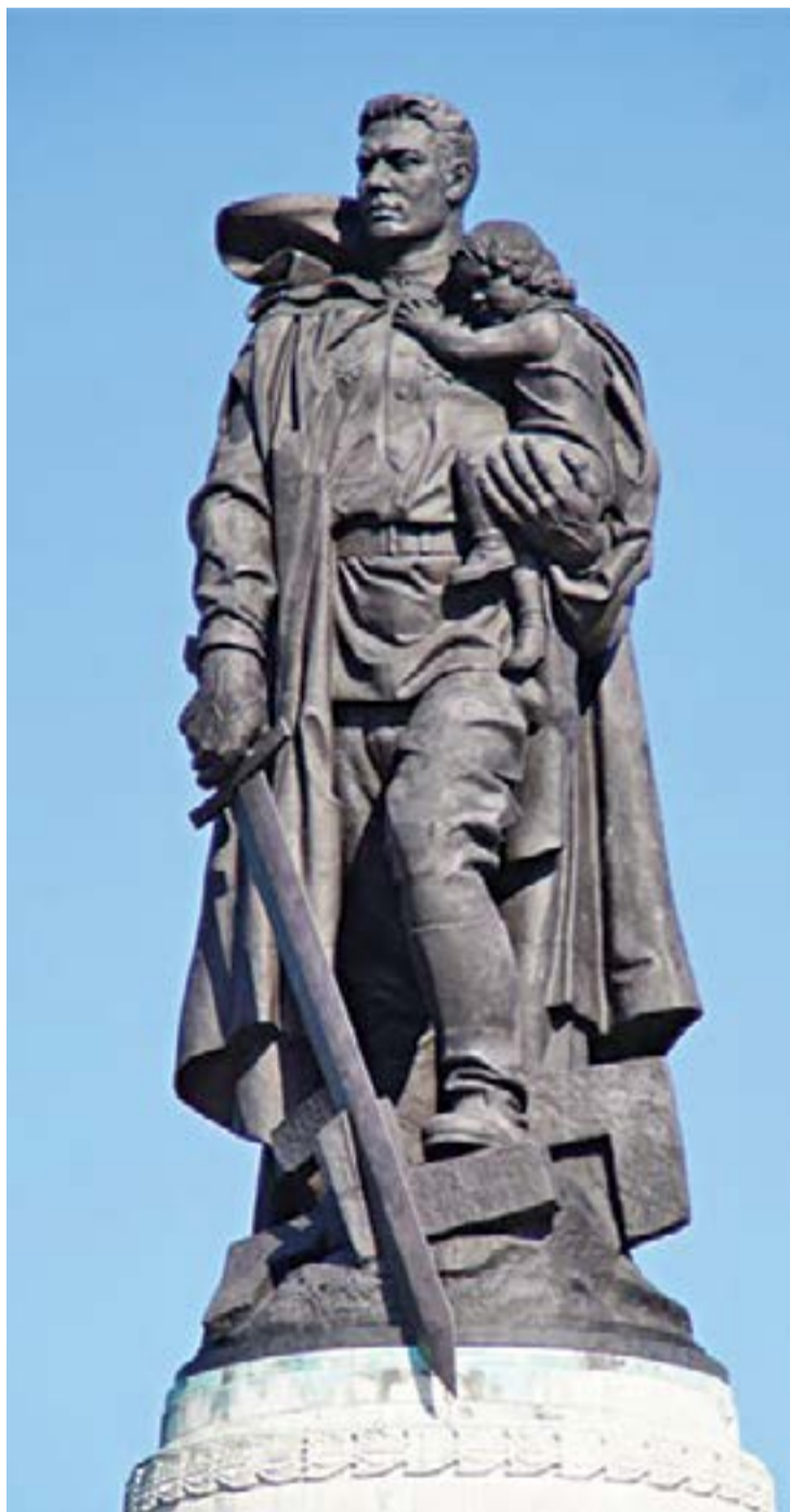
Паметник на съветския войник в Трептов-парк - Берлин