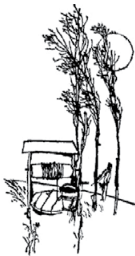
ХУД. ГЕОРГИ ТРИФОНОВ

Помниш ли, помниш ли в тихия двор шъпот и смях в белоцветните вишни? Ах, не пробуждайте светлия хор, хорът на ангели в дните предишни - аз съм заключеник в мрачен затвор, жалби далечни и спомени лишни, сън е бил, сън е бил тихия двор, сън са били белоцветните вишни!