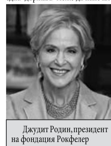
Джудит Родин, президент на фондация Рокфелер

В цитираната по-горе статия, Рей Далио разказва, че "като студент, през лятото припечелвах, чистейки пода на Нюйоркската фондова борса. На 15 август 1971 вечерта, когато президентът Никсън обяви, че САЩ се отказват от златното обезпечение на книжните долари разбрах, че правителство не може да изпълни поетите си обещания към кредиторите т.е., досегашия долар, с който разполагаха хората, преставаше да съществува. Де-валвация. Целият свят очакваше апокалиптично сгромоляване на Нюйоркската фондова борса, но това не стана. На сутринта, акциите се повишиха с 4%." Анализирайки случилото се, Долио стига до извода, че има сили, които дирижират събитията и предприемат решения, облагодетелствайки малка група от хора за сметка на болшинството. Америка не само се спасява от дефолт, но с откриващата се възможност