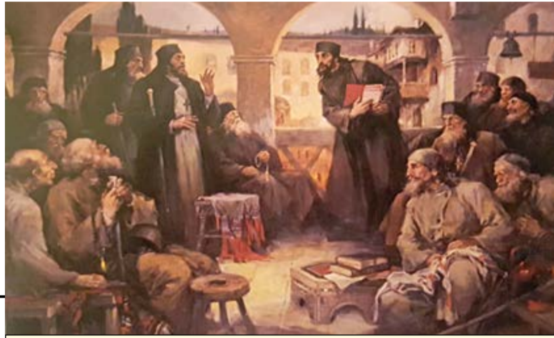
Паисий показва „История Славянобългарская“ пред монасите от Зографския манастир