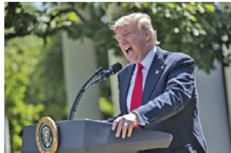
Президентът Тръмп оттегля САЩ от Парижкото споразумение за климата

използва парите за обработка на медии, политици и демократични сили. Далечната му цел остава изчезване на националната държава.