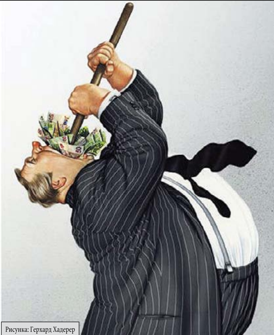
Рисунка: Герхард Хадерер