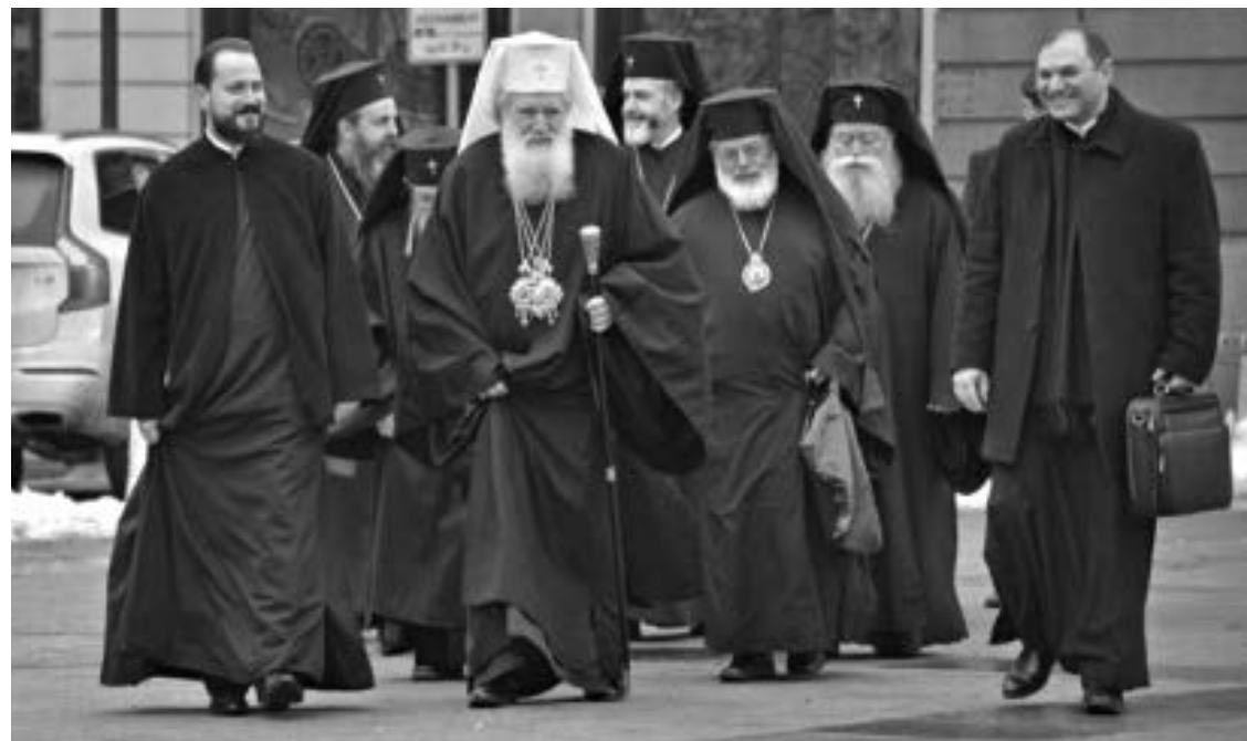
Светият синод на Българската православна църква

2. „Публичните дебати, заявява тя, започнали преди няколко години около ратифицирането на Истанбулската конвенция, разпространяват дезинформация и потвърждават вековните стереотипи за ролята на половете в обществото.“ И още нещо, което съвсем не е маловажно – г-жа Миятович изтъква, „не този режиди се разпространява и по отношение на Стратегията за дете-