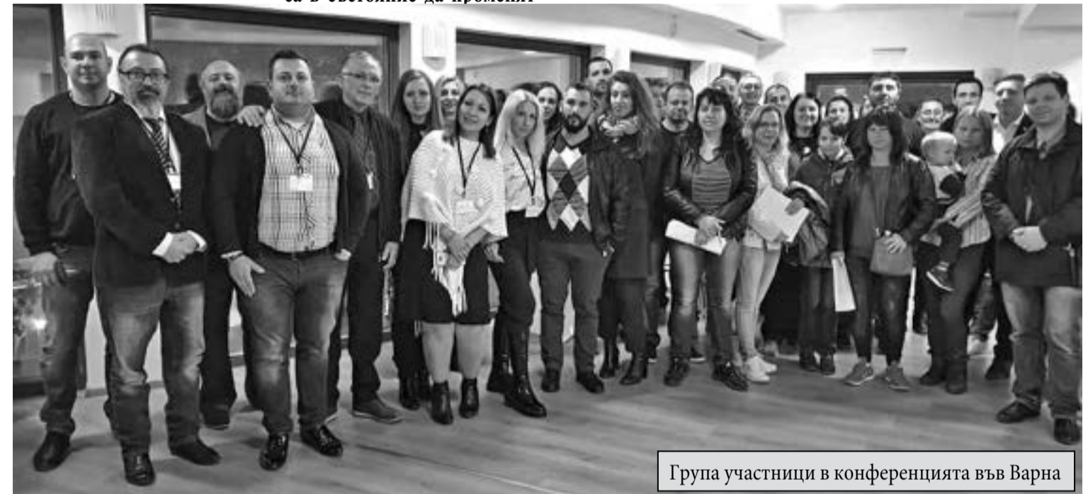
Група участници в конференцията във Варна

7. Право на свобода на изразяване на мнение: свобода да търси, получава и предава