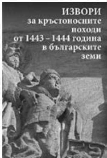
ИЗВОРИ за кръстоносните походи от 1443-1444 година в българските земи

Третата част е „Стихотворни творби (поеми, плачове, епифонии)“. Ето как се нарича поетичното творение на Михаил Бехайм: „Тук тази поема разказва за крал Владислав, краля на Унгария, как той воюва срещу турците“. А „Плач за смъртта на краля на Полша“ от галицийския поет Николай Пе-