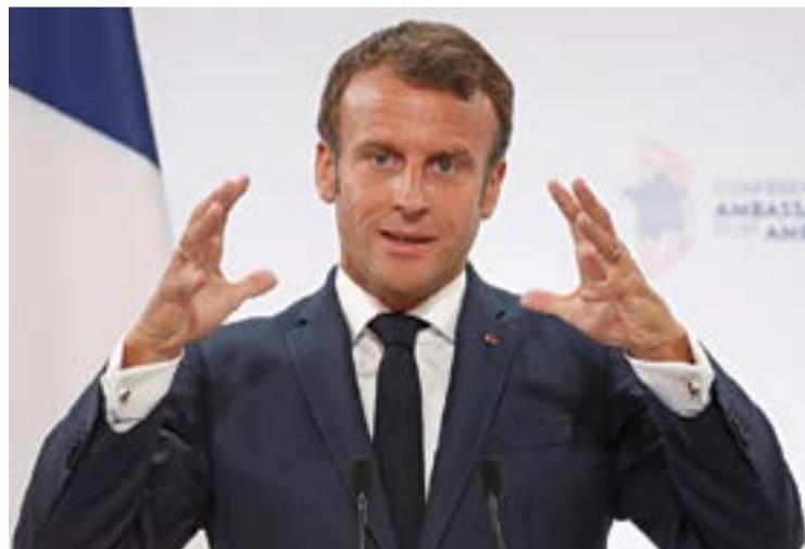
Емануел Макрон, президентът на република Франция

В книгата си "Евреите, светът и парите", Жак Атали пише: „В този жесток свят, управляван с помощта