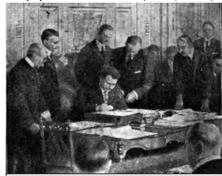
Александър Стамболийски подписва Ньойския мирен договор - 27 ноември 1919 г.

вид, е забранено, както за отделни лица, така също и за дружества, организации и институти от каквото и естество да са те.“ Като боеен материал се определя оръдията, гаубиците и мортирите и боеприпасите за тях, както и „всичко носимо бойно оръжие и картченници от модел употребяван в българската войска или в друга армия, както и pistolетите или револвери, модела на които се определят в следствие от Посланическата конференция,