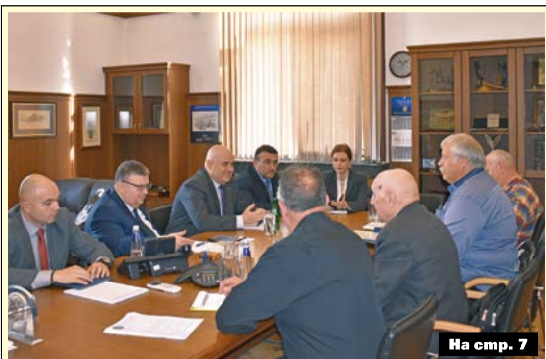
На стр. 7