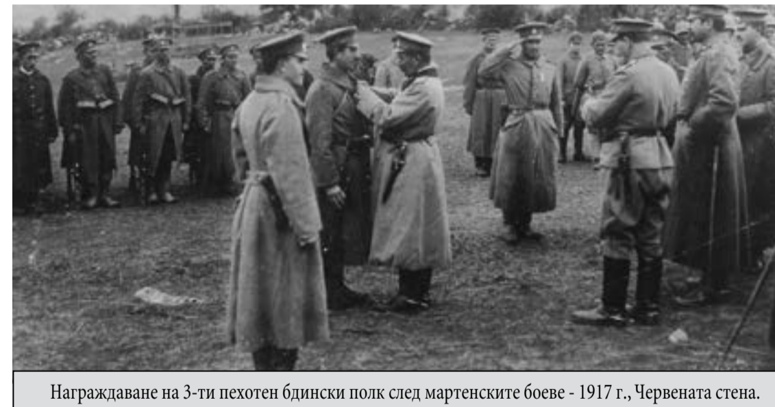
Награждаване на 3-ти пехотен бдински полк след мартенските боеве - 1917 г., Червената стена.

Държавната военна фабрика се изгражда в София на базата на Софийската артилерийски арсенал, а през 1927 г. се премества в гр. Казанлък. По-нататък се посочват точно изискванията към ограничения инвентар и производството, които също са впечатляващи! Фабриката трябва да работи максимум 8 часа дневно, 250 дни в годината. Количествата произвеждани оръжия, боеприпаси и др. също са точно определени: пушки и карабини с ножове – на месец 300 парчета; военни pistolети – на месец 30 парчета; картченници всички видове – на месец 3 парчета; оръдия гаубици и мортирите с лафети – за година 2 парчета; саби – на месец 50 парчета; патрони за носимото оръжие – за работен ден – 40 000 парчета; снаряди за артилерията – за работен ден 25 парчета; снаряди за минохвъргачки – на ден 5 парчета и т.н. Тези числа се определят като допустим максимум, но се коригира с изискването, че „годишното производство ще трябва да бъде винаги ограничено с оглед на най-необходимото за поддържането на оръжията и бойните припаси в комплект, съгласно указанията в чл. 1“. А там видяхме каква е живата сила и какви оръжия се допускат за въоръжаването ѝ. Само за сравнение ще посоча, че по време на Балканската и Междусъюзническата войни (1912-1913 г.) пушките и карабините достигат 378 660 броя, pistolетите „Парабелум“ – 4 450 бр., револверите „Смит & Уесън“ – 1508 бр., сабите