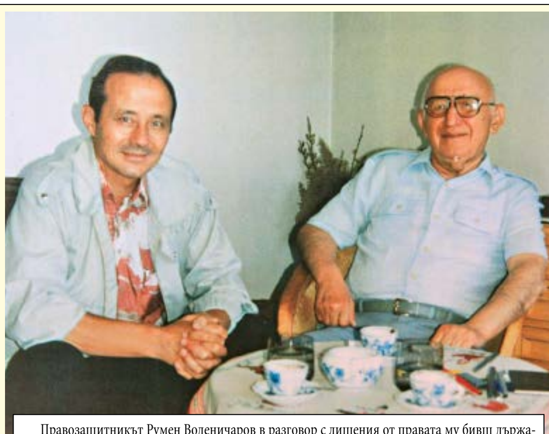
Правозащитникът Румен Воденичаров в разговор с лишения от правата му бивш държавен глава на НРБ Тодор Живков