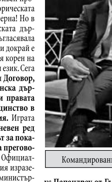
Командированите Петър Стоянов, Зоран Заев, Екатерина Захариева и Росен Плевнелиев

делено от Захариева като „една от най-ползотворните ми работни срещи до момента днес беше с генералния секретар на Международния азербайджански център „Низами Ганджеви“ Ровшан Мурадов и президента (2012-2017 г.) Росен Плевнелиев“.