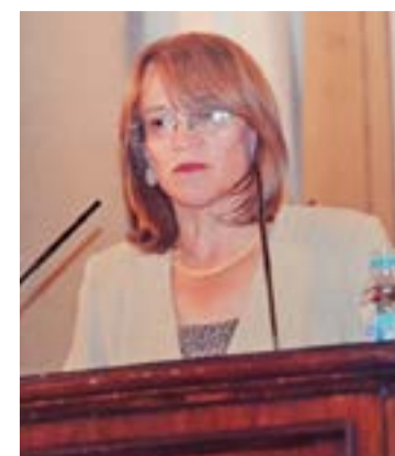
Защо названието „българи мохамедани“ е най-ужасно

сред всички прозвища – локални или по-общо, за българите, изповядващи ислям?