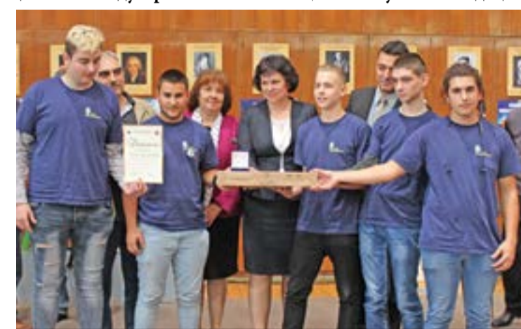
Извънредната награда от 1000 (хиляда) лева и плакет от Община Горна Оряховица бе присъдена на Професионална гимназия „Ген. Владимир Заимов“, град Сопот.

Тази година изложението даде възможност на новосъздадени фирми и клубове, занимаващи се с обучение на деца и