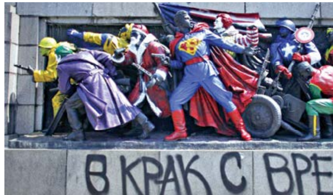
В КРАК С ВРЕ

трябва да знаеш какво означава това и доколко е възможно да бъде вярно. Още повече когато днешната ни държава открита и доброволно се е отказала от „суверенитет“ с членството в НАТО и в Европейския съюз. За „европеец“ това е благодат. Обаче точното обозначение на статута ѝ е именно протекторат. Или