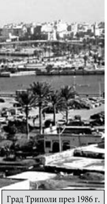
Град Триполи през 1986 г.

Да не забравя: докато пътувахме за Бенгази видяхме и двореца на бившия крал Идрис на една височина край пътя. Интересно че дворецът му е запазен - най-обикновена постройка, поне отвън.