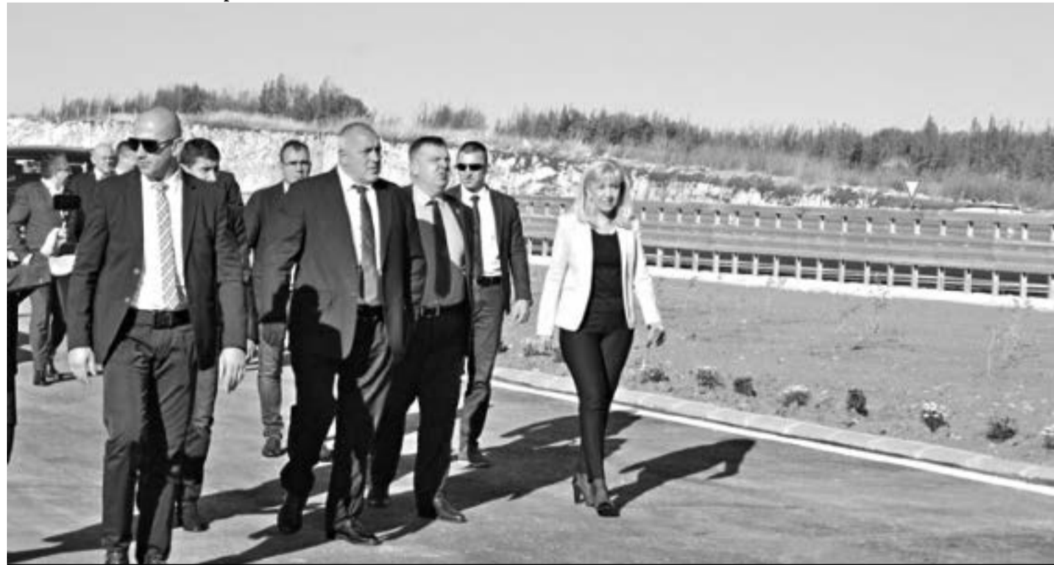
Министър-председателят Бойко Борисов откри нови 9 километра от магистрала „Хемус“ и напредва към края на пътя

Хубаво, ама неблагодарното племе, което според слуха наричат народ, гражданско общество, тъпна или електорат, не може и не иска да забравя свинския геноцид. Както и лъжите, изречени на висок глас от „Премиера Слънце“. Например, за 3,5% икономически растеж, за рекордни износ, за ръста на доходите, в това число на учителските заплати и тези на медицинските работници. И, разбира се, за нулевата безработица и дори за липсата на квалифицирана работна ръка, която спира чуждите инвеститори, дето иначе се редят на опашка да си влагат парите у нас. Други пречки пред чуждите инвеститори няма, понеже правителството и Прокуратурата са преборили контрабандата, организираната престъпност, корупцията и другите злоупотреби с власт. И ако пред МС, НС, Съдебната палата, БНР и БНТ периодично се събират „кресливи“ протестъри (вкл. майки на деца с увреждания, медицински сестри или близки на убити и осакатени от престъпници, които депутатите са удостоили със съкратено разследване, а съдиите са освободили предсрочно поради ходатайството на Български Хелзински комитет), това е доказателство за наличието на функциониращи демокра-