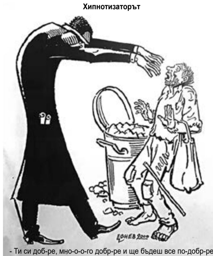
- Ти си доб-ре, мно-о-о-го доб-ре и ще бъдеш все по-добр-ре

та и как хората богатееят и добруват без да разберат под сянката на Булгарбаши Бойко Борисов и неговите съпартийци. А онова, което някои наричат корупция, е само субективно усещане, подхранвано от завистливата опозиция и някои проводници на чужди сили като РСЕ.