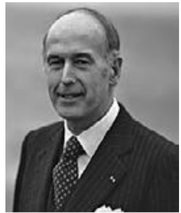
Валери Жискар д'Естен

Кадрите от школата на Юриаж са тези, които ще му доставят концепциите. Някои от тези лица са познати: около професора по икономика Франсоа Перу намираме журналиста Юбер Бьов Мери, основател на вестник „Льо Монд“, а също така и Пиер Юри и Пол Рьотер, които ще станат основните сътрудници на Моне. Първият ще му подсказва концепцията за „общност на суровините“ през 1951 г., а вторият – тази за „Общия пазар“ през 1957 г. Рьотер ще бъде част от малка група, назована да работи предложеното в плана Шуман, към който ще бъде привлечен като юрист. Юри, също близък на Моне от работата им в Комисариата по планирането през 1947 г., беше началник на отдел „Икономика“ на Върховната власт на СЕСА, преди да му се повери по-късно определяща роля при редактирането на Договора