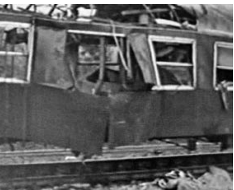
На 9 март 1985 г., на гара Буново, бе взривена бомба поставена във вагона за майки с деца на влак № 326. Загинаха 7 души но коварният замисъл е бил взривът да бъде произведен в тунела „Гълабец“, който отстои само на 1200 м след гарата

След 10 ноември българската държава отстъпи и се отвори място за едно голямо предаване имената на българските разузнавачи, работещи на прикритие зад граница, и бе