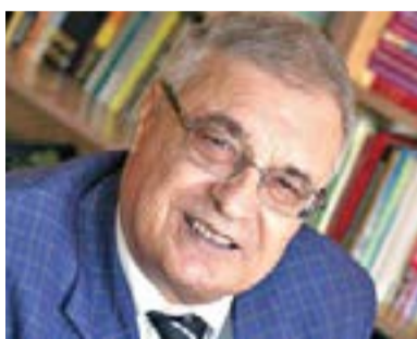
Проф. д. с. н. Георги Найденов

9-ти септември е несъмнено дата, която разделя нашата нация. Той е възлова точка във водещата се от Войнишкото въстание през 1918 год. гражданска война в България. На 9-ти септември Отечественният фронт, в който водещо място има Българската комунистическа партия, завзема властта и в нашата страна започват революционни трансформации. Гражданската война продължава още няколко години. Но през 1948 г. в България се установява стабилен авторитарен политически режим. Гражданската война „утихва“. Започва успешно „строителство на социализма“. Разделението в обществото, обаче остава. Победената фракция на елита, макар и „преклонила глава“, запазва омразата си към победителите и към деня на техния триумф – 9-ти септември. Това стана видно, когато на 10.11.1989 г. в управляващата класа се извърши вътрешен преврат. Фракцията, извършила преврата ловко използва омразата на „бившите“ към победилите ги „комунисти“, и ги използва за своите цели.