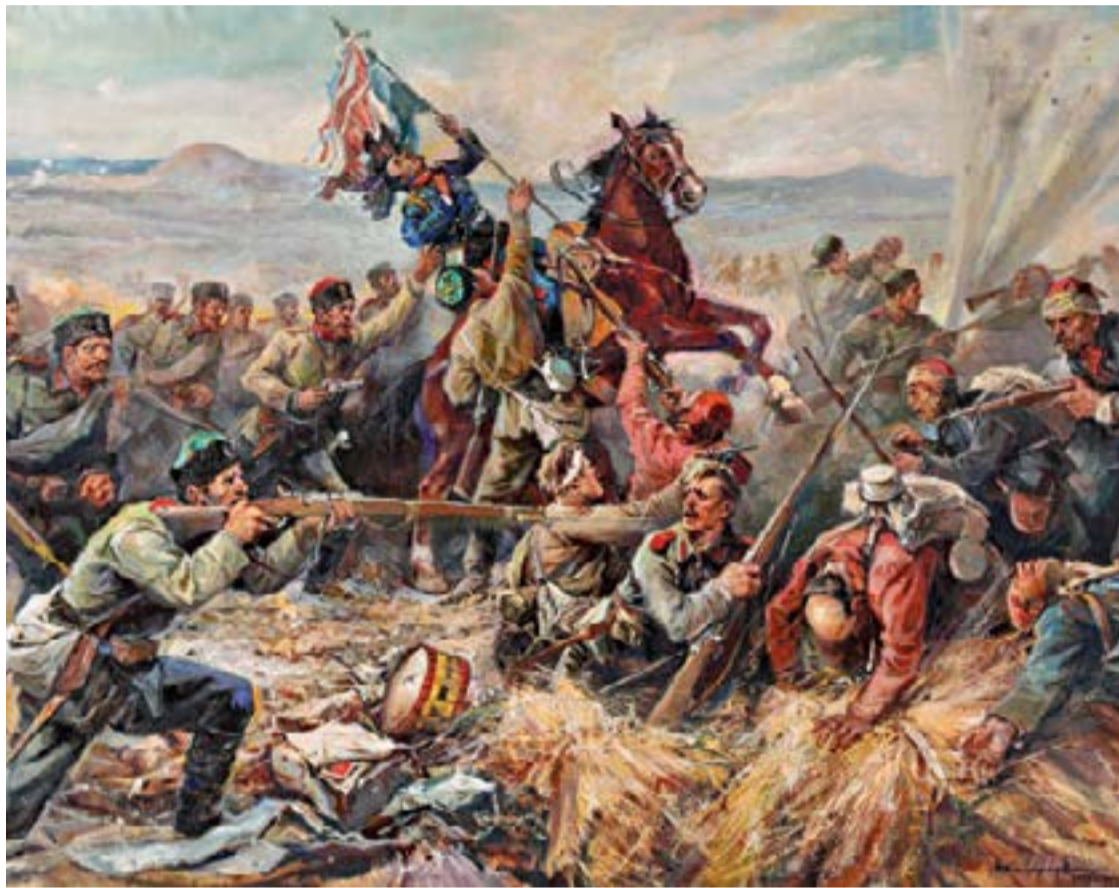
Боят край Стара Загора за спасяване на Самарското знаме. Гибелта на подполковник Калитин