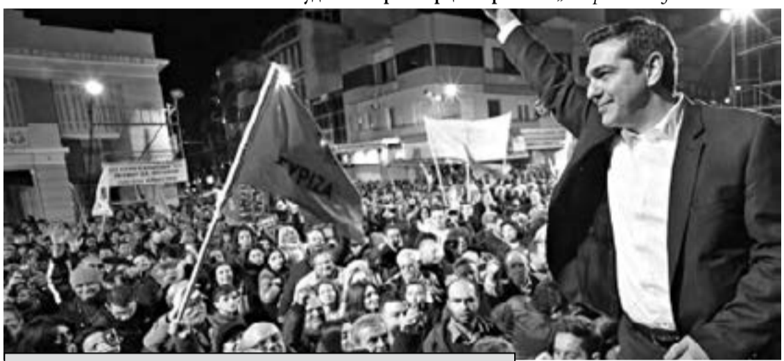
Котузовската тактика на Ципрас съхрани „Сириза“

На първо място правителството на Ципрас успя да осигури устойчив растеж на гърцката икономика, успя да въведе ред в публичните финанси и главно