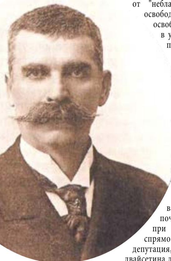
Иван Вазов - 1880 година

С неописуем блясък и великолепие, с небивала тържественост се отпразнува юбилеят. Киев, окичен със знамена, а вечер илюминован, беше добил необикновено празничен вид; в улиците гъмжеше гъсто множество народ, сред което групите на славянските депутации, отличени със златни жетони на гърдите, минаваха, поздравявани с почит и умилението от добрия руски народ. Богослужения, водосвети, шествия до Днепър, до мястото, дето се е бил кръстил светият княз Владимир с народа си, военни паради, обеда, речи, тържества, разходки с музика на параходи по реката, гърмеж на топове и камбани, посещение на манастири и скитове, скрити в горис-