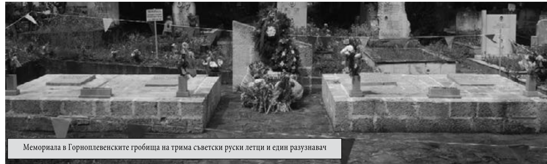
Мемориала в Горноплевенските гробища на трима съветски руски летци и един разузнавач