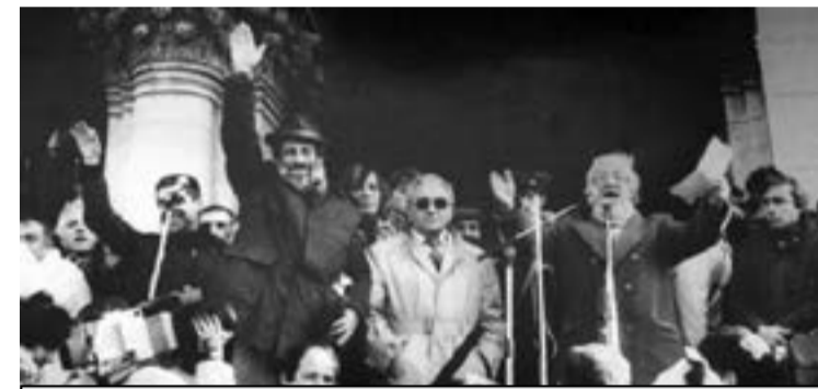
На 18 ноември 1989 г. пред храма „Св. Александър Невски“ в София се събраха над 150 000 души, които със сигурност бяха жадували за този миг.

българските капиталисти. Те бяха натоварени да разрушат старата система с всичките й недостатъци, но и с достойнствата й, да вземат и малкото, което притежаваха обикновените хора, да заворзат заводи и фабрики, да разрушат земеделите и животновъдството, здравеопазването и образованието, да опшлят културата и езика.