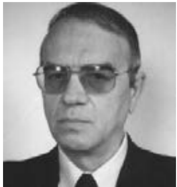
Проф. Евгени Гиндев

света (в Западна Европа този процент е между 3-4 % ; в абсолютни числа, те са 1,3 милиона! (данните са публикувани във в. „24 часа“ от 5.02.2019 г.)