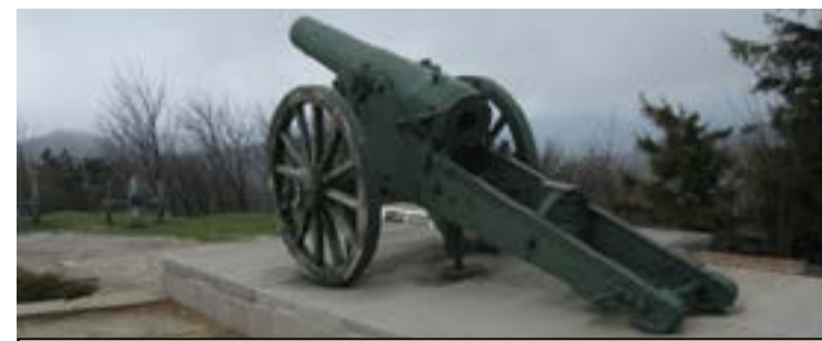
Връх Шипка - едно от оръдията на Стоманената батарея, закупени от Московският славянски комитет.

На 17 април в Мраморната зала на Руския културно-информационен център в София бе открита изложба, посветена на 195-та годишнина от рождението на известния руски общественик, публицист и поет Иван Аксаков.