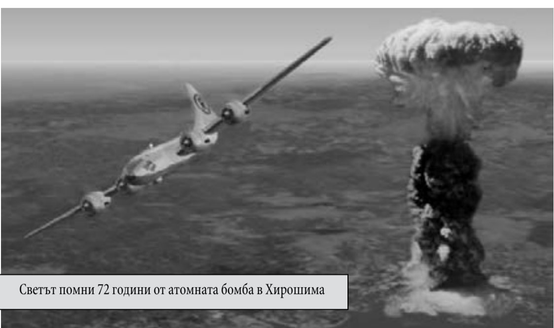
Светът помни 72 години от атомната бомба в Хиросима

На този фон изцепките на Соломон Паси, бивш външен министър на Република България при управление на Симеон Борисов не изглеждат изключение. В последните дни той се прослави с две предложения, към които се придържа от дълги години : Първото е: в България трябва да има военни бази