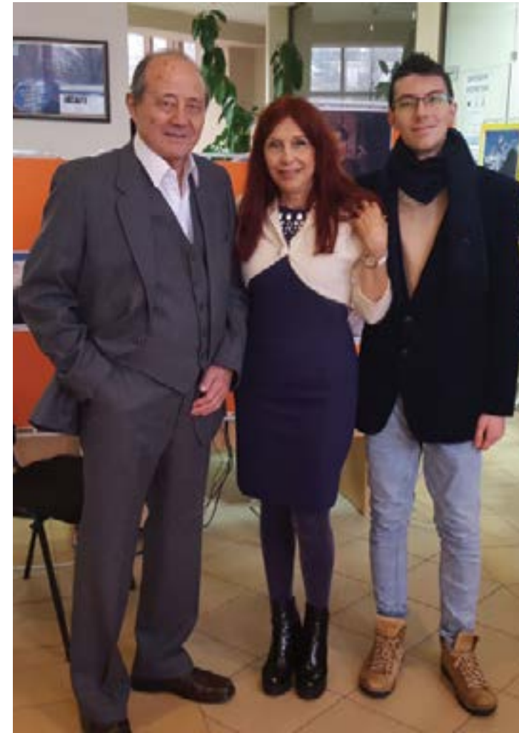
Семейство Воденичарови на откриването на изложбата 40 години Хималария.

Скоро отново заминава за чужбина, където работи като учител по математика, английски език и аеробика. В политическия отдел на посолството в Токио издирва и обработва статии, в които се споменава България в различни аспекти.