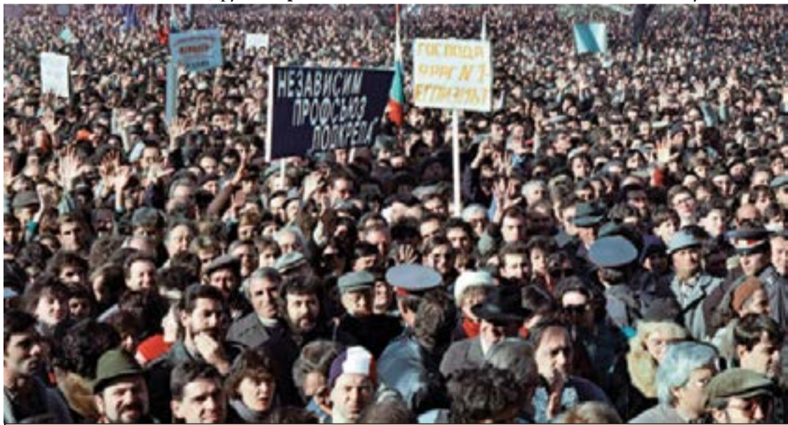
Първият свободен митинг - 18 ноември 1989 г.

Неолибералната пропаганда упорито внушава, че причината за нашите злини, неуредици и мизерии е националният ни характер, неумението ни да се справяме с трудностите, предателската ни робска същност, която ни кара доброволно да се оставяме други да ни поробват и да ни правят послушни слуги. Тази пропаганда умело прехвърля бедите от болната на здравата глава. Тези беди в никакъв случай не са заради националната душевност, а заради социалните злини на общественото устройство. Те разрушиха морала, отвориха вратите пред алчността, покварата, жаждата за богатства; те внушиха на необразованите, неуките, крадливите, жестоките, немилостивите, че е дошло тяхното време да ръководят държавата и определят правилата и нормите на нашето съществуване. Те изпълзяха като гнусни хлебарки и оттротровни змии от тъмните ъгълчета на времето ни и веднага се впуснаха в пъ-