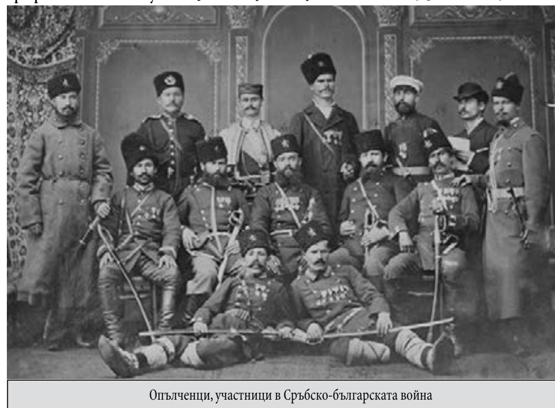
Опълченци, участници в Сръбско-българската война

Парадоксално, но времето потвърждава тези тъжни прозрения на големия хума-