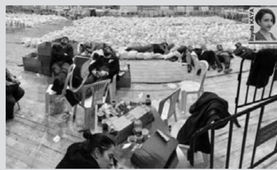
Снимката, която виждате не е от София, а от Истанбул и е поместена във вестник „Джумхуриет“ (06.04.2019). Изводите оставяме на вас. „ЗОРА“.

Но нищо не може да се сравни с отчаяните опити на властта да прикрие своя разгром в по-големите градове на Турция. Масово се оспорват пред Висшата изборна комисия (YSK) получените от опозицията резултати, настоява се за ново преброяване на гласовете, за отстраняване на победителите чрез скалъпени обвинения в подкрепа на терористични организации и водене на теро-