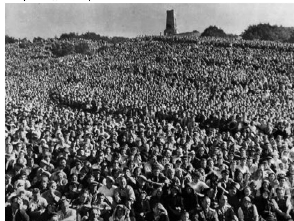
Връх „Шипка“, 26 август 1934г.: 100 хиляди българи на поклонение при откриването на Паметника на Свободата. Между тях са и 80 опълченци, участници във величавата Шипченска епопея.

През 1352 г. - масови кланета е имало в Айтос, Ямбол и Пловдив. През 1359-1364 - масови кланета в Стара Загора, Пловдив и Сливен. Тогава е избито и отвлечено в робство цялото население на градовете Венец и Сотирград и те престават да съществу-