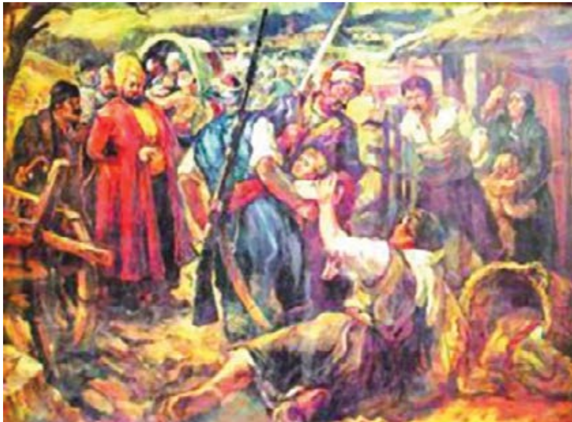
“Кръвен данък“ - Художници: Б. Григоров и Б. Данков