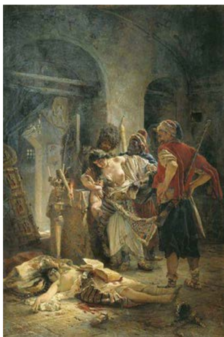
България, масово изнасяване и гавра с християнско светилище

Повечето хора биха искали да мислят така. Някои си представят натоварените с роби кораби от миналите векове - това били скърцащи дървени съдове с трюмове, претърпени с уплашени хора, които били държани в почти невъобразима мизерия. Разбира се, подобни кораби не плават повече по море и съвременните международни споразумения обявяват този вид робство за незаконно. Но въпреки това робството съвсем не е изчезнало. Представителите на организацията за човешките права „Антиислейвъри Интернешънъл“ изчисляват, че 200 милиона души все още живеят под някаква форма на робство. Те работят в условия, които може вероятно да са по-лоши от обстоятелствата на робите през миналите векове. Всъщност някои изследователи стигат до