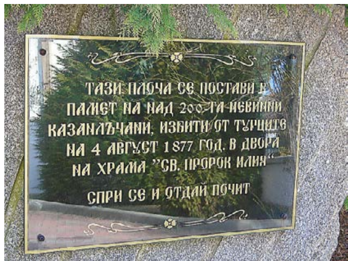
Плоча в църквата „Св. пророк Илия“ в Казанлък

През 1877-1878 г. през Руско-турската освободителна война турците извършват погроми и кланета и в Златарица, Елена, Котел, в Новоазгорско, Стремската (Карловската) долина, Панагюрище (погромът е дело на редовна турска войска), Самоков, Белово, Брезник (тогава Карагаич), Чепеларе, Златоград, Симеоновград (тогава Търново Сиймен), Свиленград (тогава Мустафа паша), Любимец, Харманли и по-навътре в Одринска Тракия, в Македония и на много други места. В Пловдив само в края на август са екзекутирани 116 българи. Стоотици българи са убити и в Сопот, в селата в Пирдопско, Казанлък, София (тур руснаците заварват 16 бесил-