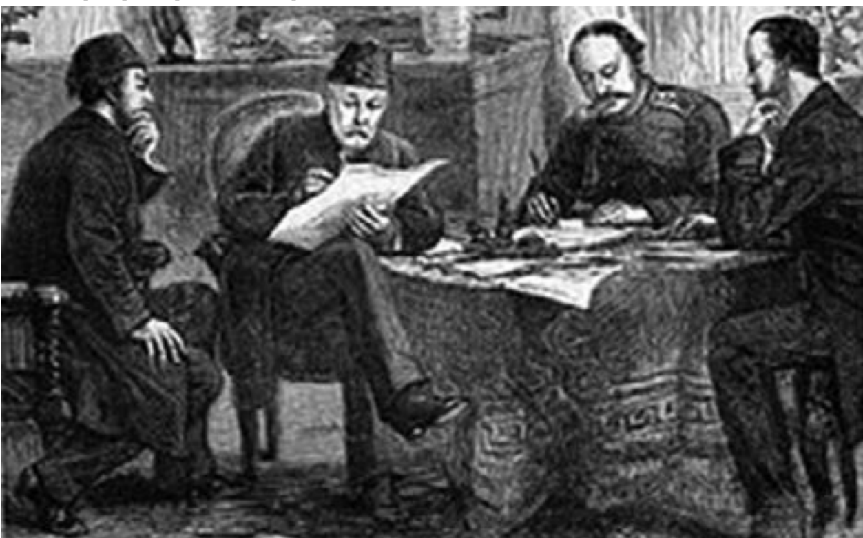
Подписване на Санстефанския договор 1878 г.

проучването на лица и събития, към които не съм имал особени сипатии. За да не бъда голословен ще приведа само два примера: въпреки че не съм фен на личността