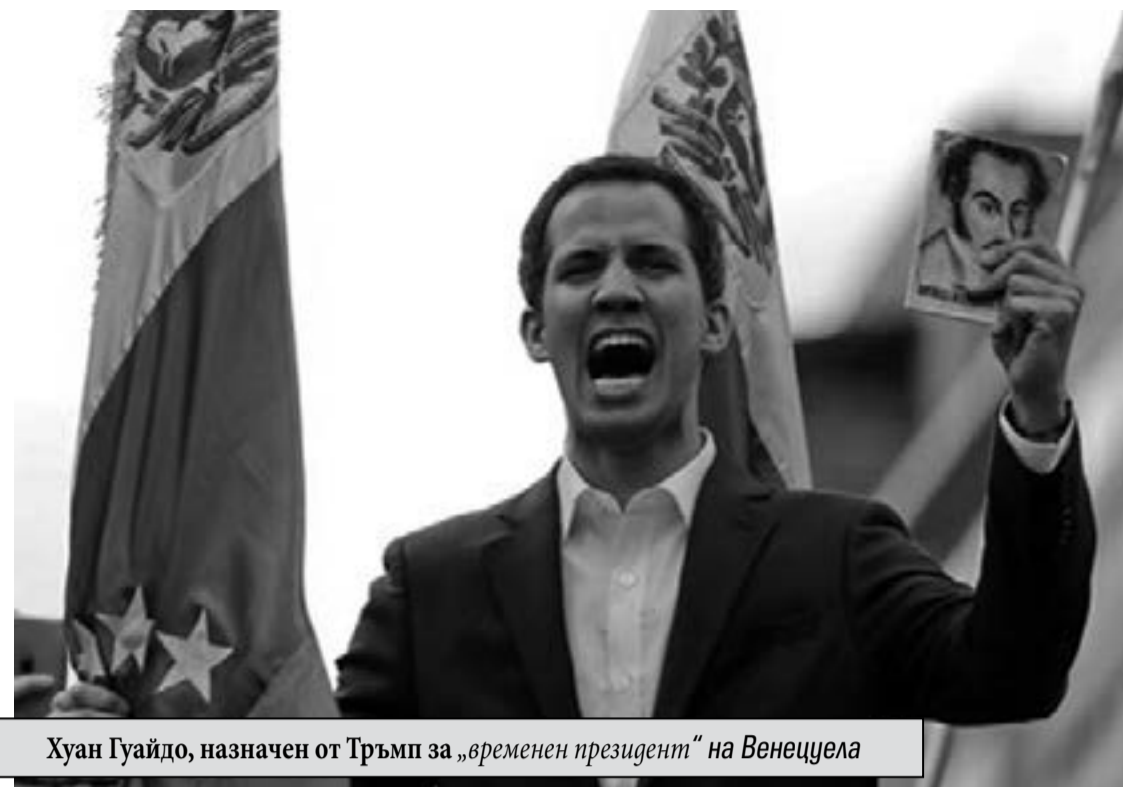
Хуан Гуайдо, назначен от Тръмп за „временен президент“ на Венецуела

Ерго, както прогнозира Корнелия Нинова, връщането на БСП в парламента заради президентското veto се обезсмисли. В такъв случай, внесеното от ПГ на ГЕРБ предложение за частично връщане на старото положение с предпочитане и подмяната на ЦИК е или лицемерие, или символично хакири, което ще има негативни за управляващите последици. Получава се един омагьосан кръг, при който ролята на „единствена опозиция“ в НС ще играе „присъдружната по някои въпроси“ партия ДПС. А това дава възможност на нашите фалшиви либерали да извиват ръцете на Бойко Борисов, както те си знаят. И „по-лесното“ (заради отсъствието от парламента на ПГ на БСП, б.а.), орташко законотворчество ще демаскира герберите и патриотите, които се заканваха „да изгегърнат“ ДПС от властта. Така, без да се регистрират, депесарите в НС ще дишат във врата на управляващите, принаждавайки ги да спрат всякакви командировки, за да поддържат кворума. Сбогом, молитвени закуски в Белия