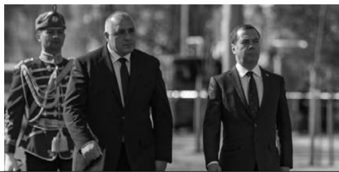
На 4 и 5 март на официално посещение в България бе министър-председателят на Русия - Дмитрий Медведев.

Борисов се оказва заложник на много сложни комбинации на непосредствената си среда. Защо не изреко-