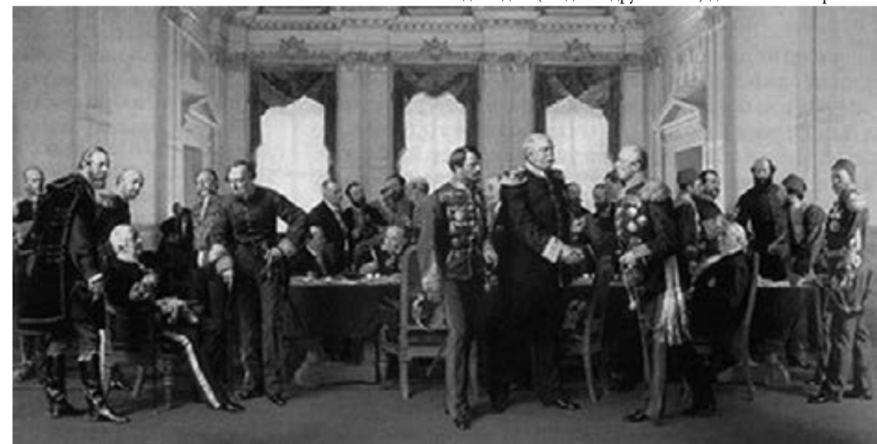
Берлинският конгрес 1878 г.

пристрастия, не само че нямат особено значение за мен, но точно обратно – пречат на обективното изцлагане на изследване историческия процес. Като всеки човек и аз имам своите политически пристрастия. По ирония на съдбата съдено ми бе да се занимавам с