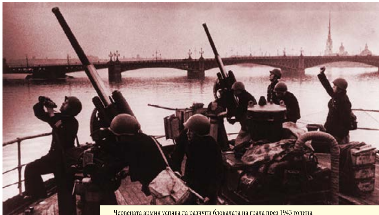
Червената армия успява да разчупи блокадата на града през 1943 година