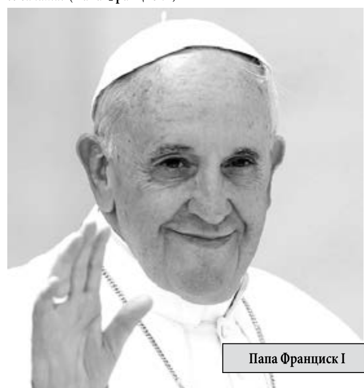
Папа Франциск I

вани за герои, а героите – за престъпници. С това се „обосновава“ варварското отношение към историческата памет на народите и свързаните с това паметници. Подобно „програмиране“ на съзнанието на подрастващите представлява посегателство върху тяхната духовна идентичност.