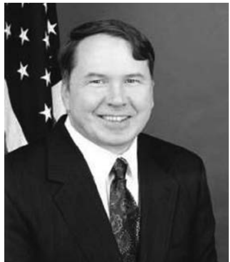
Интервюта в българския печат с бившия посланик на САЩ в България Уилям Монтомъри (193-1996г.), показват, че инициативата за приемане на американския елит, като съюзен е преди всичко на самия български елит, че българските политики и интелектуалци-идеолози са проявявали извънредна активност да бъдат приети от американския елит, като негови агенти за влияние в България.

имащи значителни икономически, медийни и пр. ресурси са извънредно силни и успяват да създадат представа в американския англосаксонски елит, че тяхната подкрепа има огромно, дори решаващо значение за избирането на президент и изобщо за резултатите в политическите борби. Тези два нови, освен еврейската диаспора в Европа, големи центри на еврейския икономически, обществен, политически, културен и т. н. живот, стават основни инструменти на англосаксонския елит в борбата му за световна доминация.