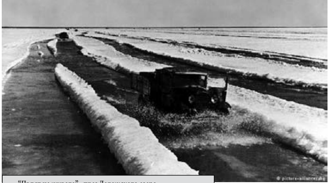
„Пътят на живота“ - през Ладожкото езеро

Въпреки разпространеното в Германия в продължение на десетилетия мнение, на Ленинград не би му се получило да избегне съдбата си чрез капитулация. Заповедта на командването на Група армии „Север“ от 28 септември 1941 година е било недвусмислено: „Да не се настоява за капитулация“. По този начин, съдбата на огромния град е предредена.