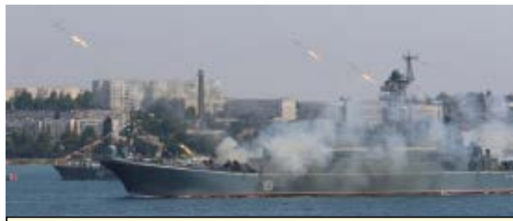
Инцидентът в Азовско море е само една от планираните провокации срещу Русия

Няма съмнение, че инцидентът в Азовско море е една от провокациите, режисирани от американския импери-