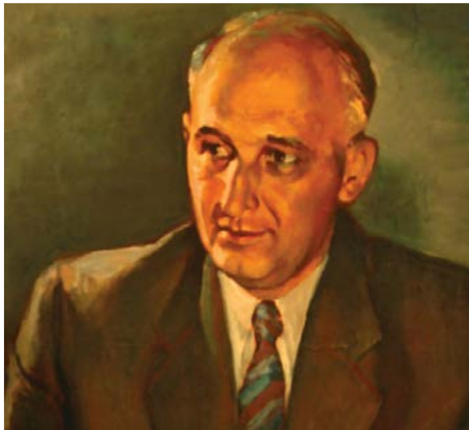
Маслен портрет на Тодор Живков. Худ. Дора Бонева