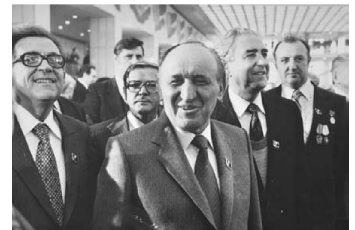
Делегация на БКП на 26-тият конгрес на КПСС (21 февруари - 3 март 1981г). Отляво надясно: Станко Тодоров, Димитър Станишев, Тодор Живков и Гриша Филипов.

на народните маси и в развитието на отделния човек, десетилетия вече не може да излезе начело на техническото, технологическото и икономическото развитие в света? Разбира се, една трезва оценка на положението изисква да се отбележи, че ние - СССР и другите социалистически страни, за кратък исторически период постигнахме огромни успехи. Социализмът показва своето явно превъзходство в социалната област. Благодарение на развитието на редица научни и промишлени отрасли СССР постигна паритет във военната област, а това е историческо завоевание.