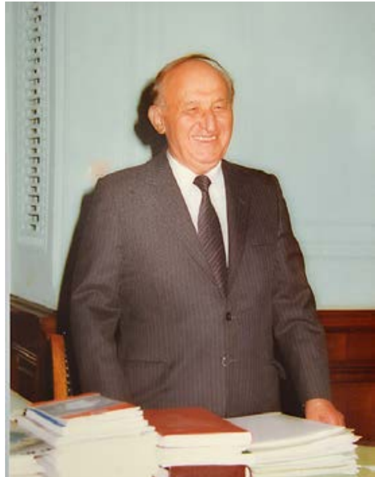
Тодор Живков (7.9.1911 – 5.8.1998г.) Генерален секретар на ЦК на БКП и председател на Държавния съвет на НР България.

ят основите на марксизма-ленинизма, за да може правилно да се управлява на всички равнища; че едва ли ни е необходимо да развиваме науките, свързани с управлението, шом разполагаме с общини истини на научния комунизъм.