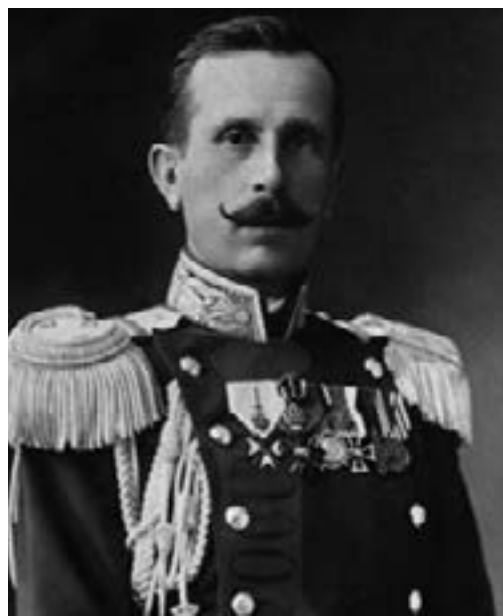
Ген. Никола Жеков

ски прийом, под прикритието на артилерийския огън, през нощта се приближават до 30 метра от разнебитената позиция на защитниците. В 5.30 часа, след пренасяне на огъня в дълбочина, още в тъмнината, мъглата и барутния дим, атакуващите вълни се хвърлят в нашите окопи и изненадват защитниците в тях, както и на излизане от скривалищата и от засло-