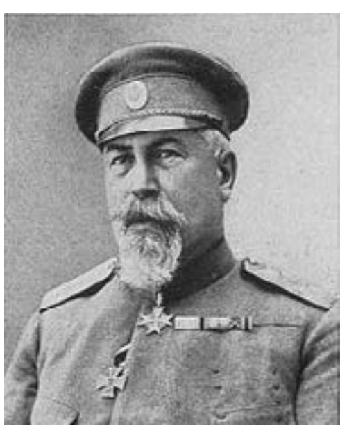
Ген. Фридрих фон Шолц

Козяците беше почти свършено неукрепена. 81-ви полк и остатъците от развитите полкове посрещат подновените атаки от сутринта с пу-