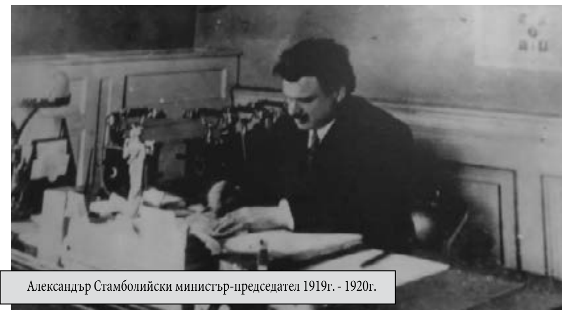
Александър Стамболийски министър-председател 1919г. - 1920г.

Така сформиралата се част от българската буржоазия имаше две характерни особености; тя бе лихварска и корупционна и нейният капитал почти изцяло отсъстваше от производството.