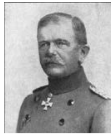
Ген. Фронше Деспре

При Добро поле българите устояха на невидания артилерийски ад, биха се героично три дни срещу преизкождащия им противник, както на Шипка, Добрич, Завоя на Черна, Каймакчалан и Дойран. Но оставени сами, недоохранени, недооблечени, невдовъоръжени, без солидни резерви в тая тежка война, накрая не издържаха. „И гладу-