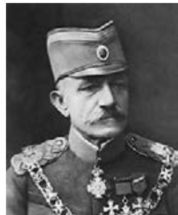
Ген. Живоин Мишич

ности и компютърни технологии. Привържениците на алтернативата Добро поле с Дойран, ако намерят подходящ софтуер, могат на своите компютри да достигнат и до неутешителния според мен резултат. По вероятната и интелигентната алтернатива е другаде – успехът/неуспехът на Войнишкото въстание. При малко по-добра организация от земеделските водачи, закоравелите, озлобените и опитни бойци от фронта щяха лесно да смелят импровизираната софийска отбрана. Погромът