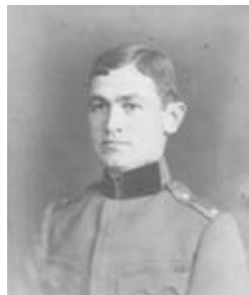
Ген. Георги Тодоров

ните. Това попречи останалата жива наша артилерия да даде