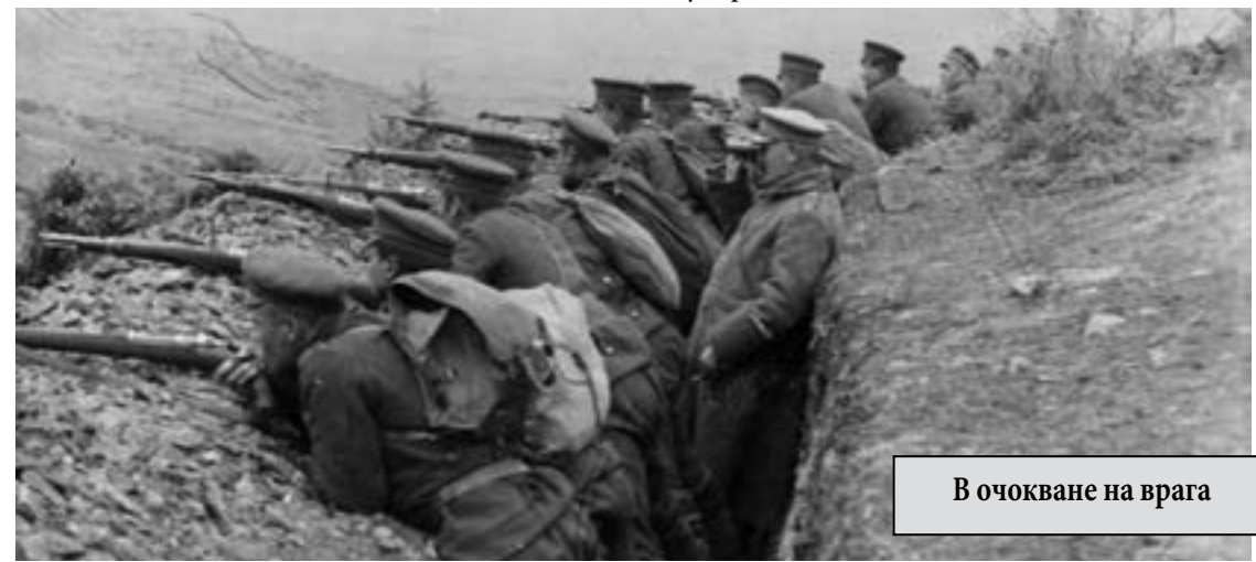
В очокване на врага