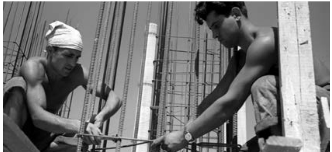
“Ние изграждаме живота, животът изгражда нас”

технологични възможности за проектиране и производство на 80-85 % от компонентите и възлите за производството на крайни изделия. Благодарение на всичко това страната е основен доставчик на компютърни системи за съветските научни изследователски и промишлени институти. Страната има основен пазарен дял на компютри в рамките на социалистическите страни. Ето какво се казва в прословутия доклад на американците Ран и Ът, писан веднага след 1989 г. в раздела “Електроника” за това, което са установили в България: “От началото на 70-те години България направи огромни капитални инвестиции (както в конвертируема валута, така и в лева) в електронната промишленост, което доведе до създаване вдъхващи уважение производствени мощности и изследователски и развойни звена в областта на микроелектрониката: синхронизирани интегрални схеми, многоканални метало-оксидни полупроводници и транзисторни полупроводници; компютърни сис-