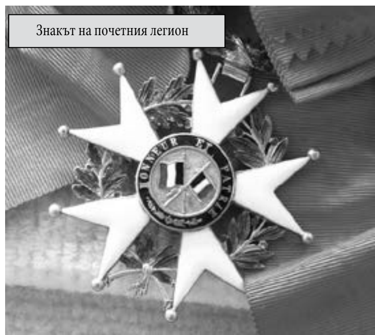
Знакът на почетния легион

пред служители на Министерството на външните работи, Министерството на външната търговия, Министерството на правосъдието и др. Като ценен консултант на посочените министерства и на Министерския съвет, той е включван в състава на прави-