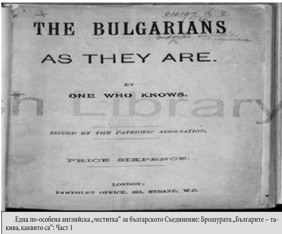
Една по-особена английска „честитка“ за българското Съединение: Брошурата „Българите – такива, каквито са“. Част 1

но, дълг на всеки англичанин, който желае доброто на своята страна, на Индия, на човешките свободи и на многото народи, населяващи Балканския полуостров, е да не помогне по никакъв начин за тази славянска конспирация, която се извършва в България. Много и стратегически по значението си въпроси, произтичат от това малко местно брожение във Филополис. Те могат да повлияят на съдбата на милиони хора и може би и на съдбата на нашата собствена Империя. В името на хуманизма и сувереността си, нека всички англичани постъпят като истински патриоти с държавническо мислене, а да не се подведат от раздухваните сантименти на разни фанатици. Не допускайте народът ни да бъде заблуден от престорените вопли за „националност“, които ще послужат единствено за нарастването на руската мощ или пък от неясните генерализации на понятието „свобода“, които ще доведат единствено до оправданието на поголовния грабеж и геноцид на всички неславянски раси. [...]