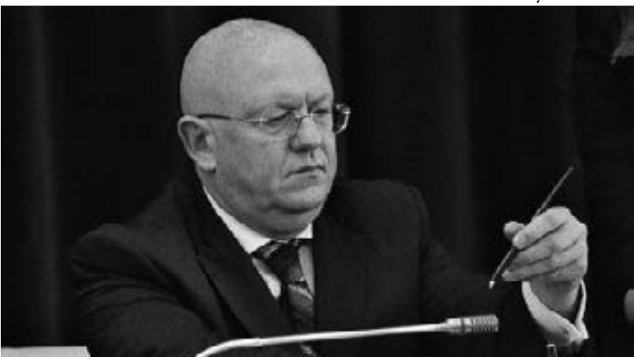
Василий Небендя: Нима смятате, че светът слепешком ще ви повярва?!

сирийският режим се готви да използва химически оръжия срещу Идлиб. Те са толкова достоверни, колкото и информацията за химическата атака на Башар Асад срещу град Хан Джейхун и предградията „Дума“ на сирийската столица. В ход е инсценировка за това, че Башар Асад е преминал „червената линия“, която да оправдае вече официалната военна интервенция на „сдружилците в престъплението“ САЩ и Великобритания. За тази цел на терена са изпратени финансираните от Англия „Бели каски“, които ще документират „зверствата“ на сирийския диктатор. Дали пък бившият британски външен министър Борис Джонсън не е прав, уподобявайки Тереза Мей на „камикадзе“?