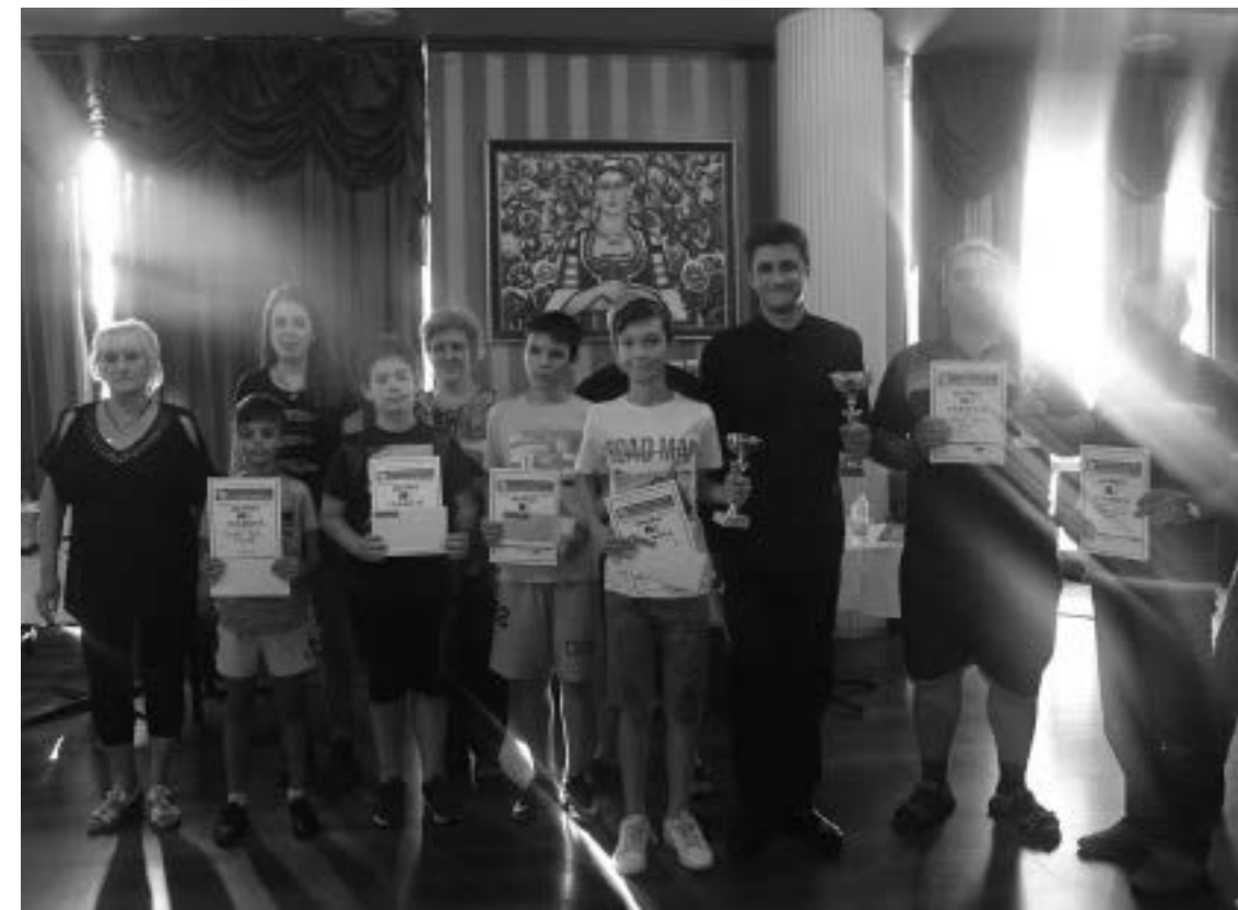
Международен турнир по шахмат „Нова Зора“

По този повод ми идват на ум следните думи от Евангелието: „Не може здраво дърво да дава лоши плодове, както и лошо дърво да дава добри плодове“ (от Матей 7:18). Очевидно е, че обществото „Мон Пелерин“ е „лошо дърво“. Следователно нобелови лауреати по икономика, които излизат от този инкубатор, са „лоши плодове“. Те са подобни на отровните плодове, които първите хора откъснали от дървото на познанието за добро и зло и ... се отровили.