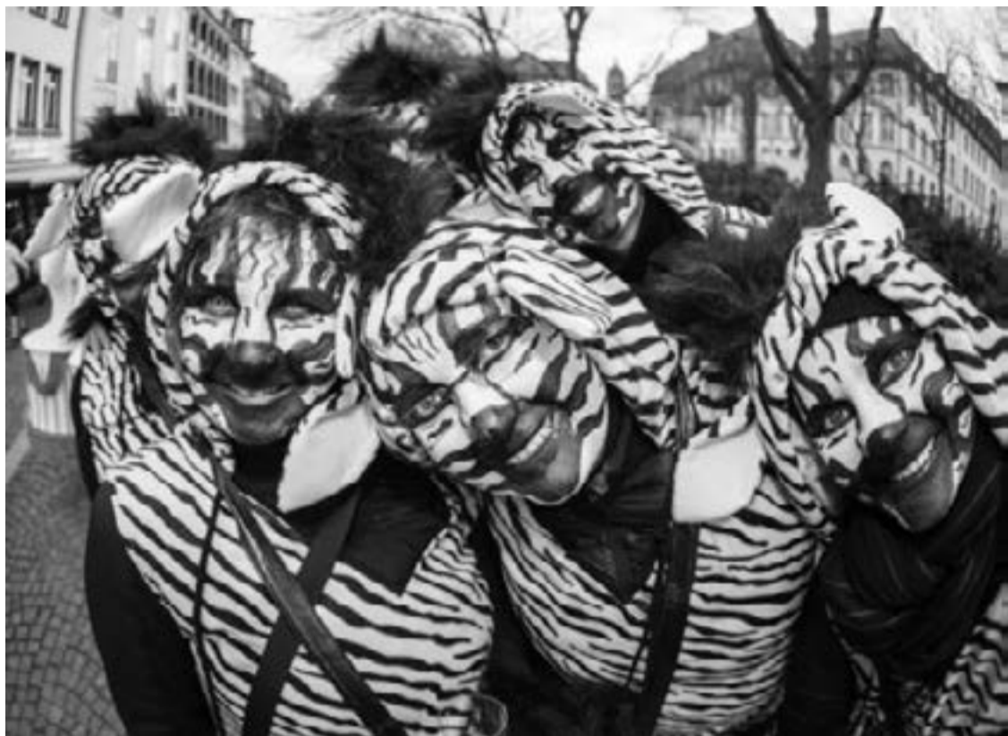
На Европейския съюз не са необходими нации, следователно не е нужен патриотизъм

На полето на идеологията ударите срещу критиците на М. се нанасят също по две линии. Първата е „тирания на вината“. Привържениците на М. представят света на Азия, Африка и Доколумбова Америка преди колониализма като рай, в който са нахлули неканеци злодеи. Техният мазохистски аргумент е: европейците трябва да се покаят за своите завоевания и колониализъм. Но тук веднага възниква въпросът „Защо арабите и турците не трябва да се извиняват за завоеванията си в Европа, за търговията с робини?..“