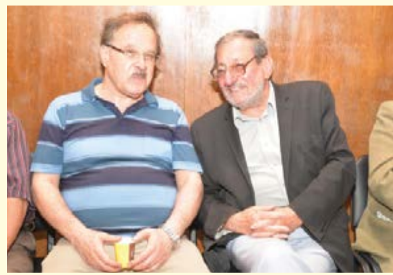
ДЕЛЕГАТИ И ГОСТИ НА 3-ИЯ РЕДОВЕН КОНГРЕС НА ПОЛИТИЧЕСКА ПАРТИЯ „НОВА ЗОРА“