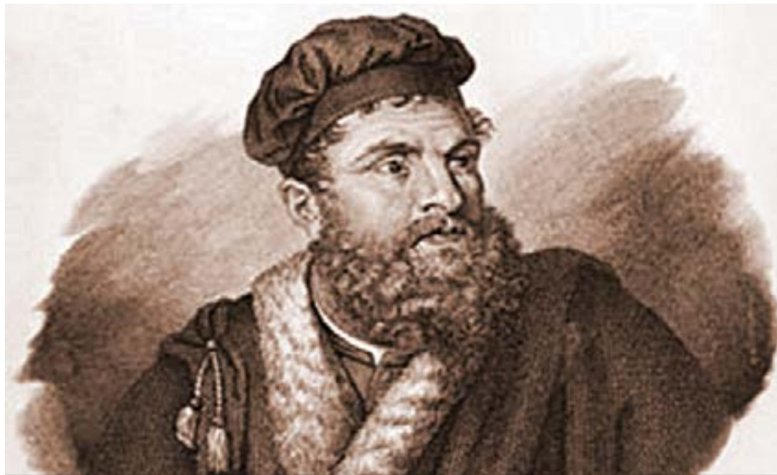
Венецианецът Марко Поло, който е роден на остров, намиращ се днес под юрисдикцията на Хърватия, при завръщането си от Китай бил хвърлен в затвора...

Ли Къцян заявиха, че целта на форума е укрепването на ЕС, но опитът с американския план „Маршал“ след Втората световна война показва, че чуждата помощ може да доведе и до политическа и военна зависимост. У нас зам.-председателят на ГЕРБ Цветанов стана официален изразител на опасенията от китайска експанзия, но доколко е оригинален или просто предава посланията на биг бродър, времето ще покаже. Многозначителен е фактът, че веднага след форума ЦИЕ-Китай в София, заместник-председателят на ГЕРБ и председател на парламентарната група зами-